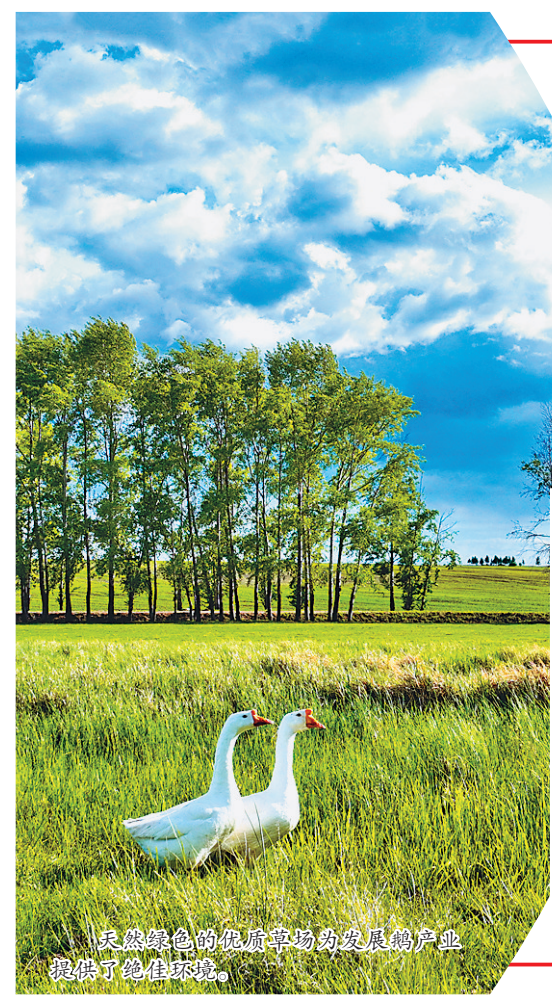
天然绿色的优质草场为发展鹅产业提供了绝佳环境。