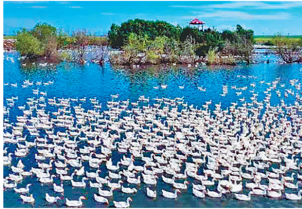
嫩江市不断丰富鹅产业链条。