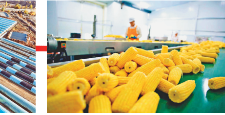
183团现代农业产业园鲜食玉米加工生产线。