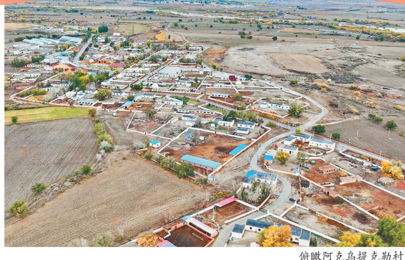
俯瞰阿克乌提克勒村。