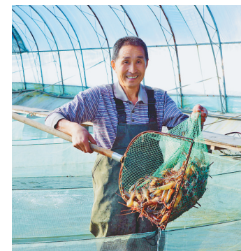
罗氏沼虾迎来销售旺季。