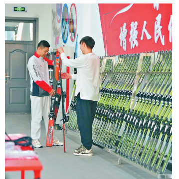
金山体育馆冰雪运动实训室。