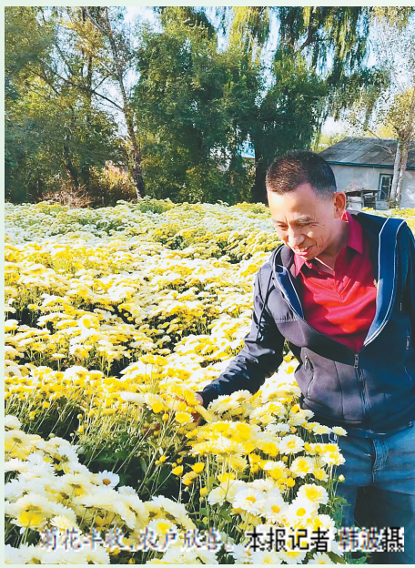
菊花丰收,农户忙碌。

大健康产业项目接续落地、多点布局,助力木兰“换道超车”,激发了转型发展新动能。数据显示,今年上半年,木兰县实际利用内资额3.1亿元,增长113.2%;财政总收入7586万元,增长30%。