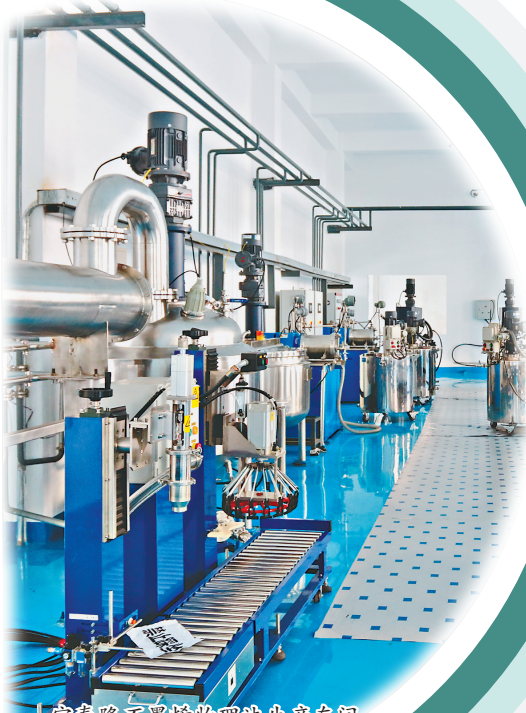
宝泰隆石墨烯物理法生产车间。

针对部分个体工商户对优惠政策申报操作不够熟练的实际情况,茄子河区税务局抽调税源管理、征管、税政等部门骨干组成服务团队,在办税服务厅对个体工商户进行“一对一”宣传辅导。办税服务厅导税人员将个体工商户涉税问题随时记入“优化服务随身记”小册子,利用“晨会夕课”集中消化解决。