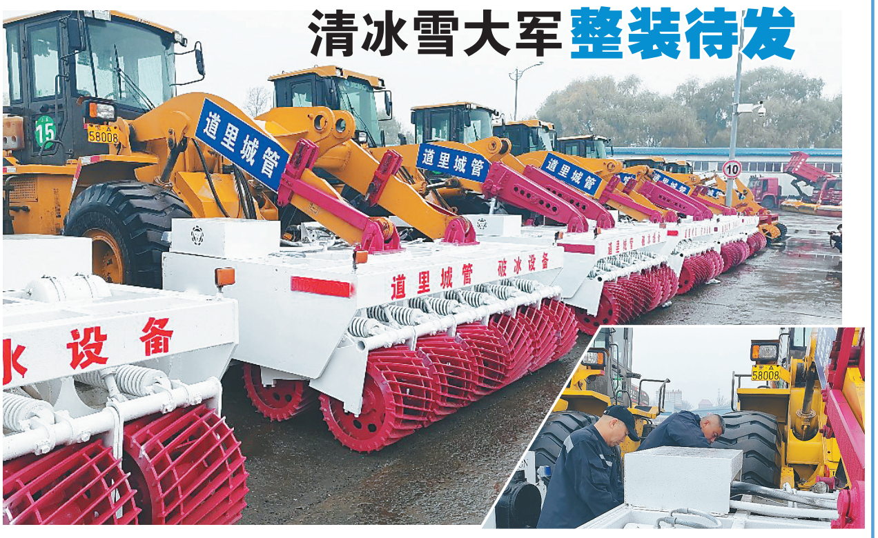
5日,记者从哈尔滨市清冰雪办公室获悉,全市已完成所有清冰雪作业设备调试、维修以及作业队伍、卸雪场地的准备工作。清冰雪大军整装待发,全力应对可能出现的暴雪、冻雨等极端天气。

七台河市气象灾害应急指挥部也下发通知,根据最新预报,七台河市气象灾害应急指挥部决定将重大气象灾害(暴雪)Ⅲ级应急响应提升为重大气象灾害(暴雪)Ⅱ级应急响应。