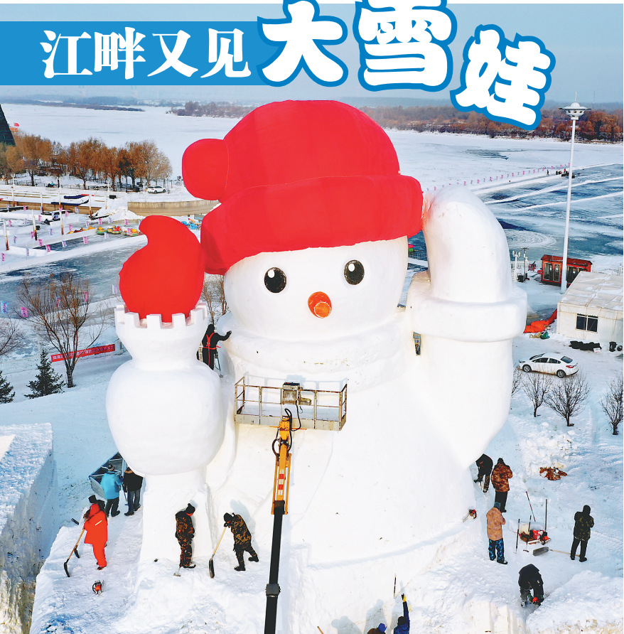
4日,哈尔滨道里区群力江畔,一座巨型雪人的制作工作基本完成,工人正在精雕细琢,做着最后的收尾工作。

哈尔滨市、牡丹江市、佳木斯市、省纪委监委、省委组织部、省发展改革委有关负责同志在会上作交流发言。各市(地)和省直有关部门负责同志参加会议。