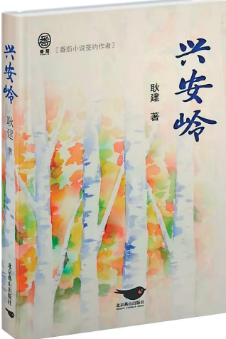
《兴安岭》 耿建 著 北京燕山出版社 2023年10月

这是一部名家散文集,史铁生、汪曾祺、梁实秋、丰子恺、沈从文等12位名家写给独行者的生命之书。