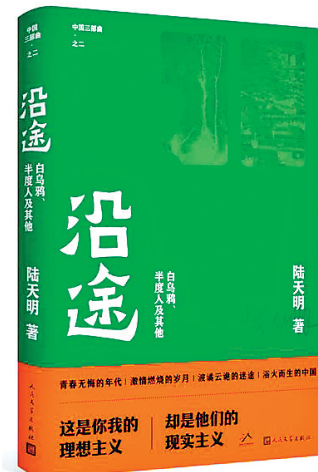
《沿途》 陆天明 著 人民文学出版社 2023年7月

我和李北山教授相识近二十年,在长期的交往中逐渐对他有了深入了解,欣赏他的博学多才,更佩服其非凡的创造力。他是一位出色的出版人和作家,五年前到大学任教,又成为一位研究型学者。他一面教书育人一面潜心写作,在进行学术研究的同时致力于中国文化传播,似乎在独辟一条中国文化传播的路径,五年来李北山佳作迭出,陆续出版了《宣纸上的中国》《手艺的终结》《小天下·中华文明(艺术卷)》等人文类著作;和清华大学刘晓峰教授联合主编了《中国风俗图