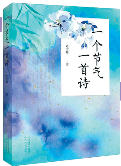
《一个节气一首诗》/章雪峰 陕西教育出版社/2023年6月

读罢此书,我领略了《朝向一朵花的盛开》这本书着实属于“热气腾腾的写作”,感谢丰富多彩的生活及我们赖以生存的大自然,我相信只要悉心、潜心钻研它们,它们就会成为取之不尽、用之不竭的创作宝藏。