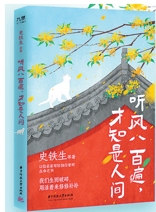
《听风八百遍,才知是人间》 史铁生等 著 华中科技大学出版社 2023年10月

二十世纪三四十年代,长江边的江东市里,一座德茂公寓见证着历史的风云变幻,人们的命运流转。民间艺人的说书与暗藏玄机的歌谣,勾勒出战争背景下世界的苍茫一片。