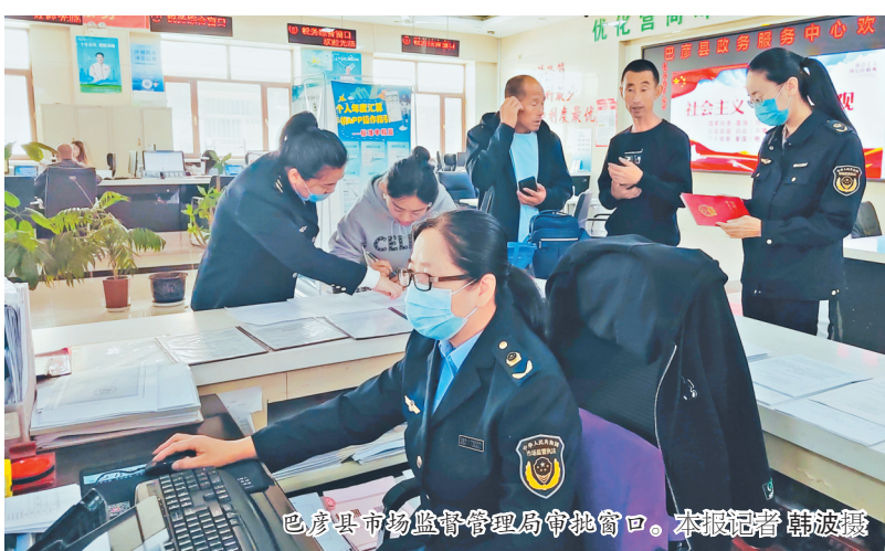
巴彦县市场监督管理局审批窗口。

为激发企业内在活力,巴彦县营商环境建设监督局以“政商沙龙”、企业家座谈会等方式,针对企业发展、营商政策、法律法规需求进行精准解答,收集梳理企业在生产经营、项目建设、政务服务、融资投资等方面遇到的难点堵点、推动问题解决。开设营商环境类诉求服务专席,为企业提供7x24小时服务,帮助企业解决“急难愁盼”。今年三季度,巴彦县12345热线共受理企业和群众诉求4851件,办结率达100%。