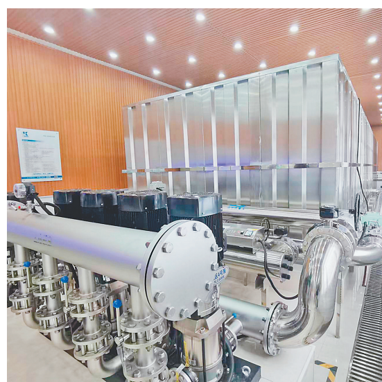
二次供水泵站。

本报讯(杨依明 记者王志强)“供水设施新建扩建工程(二次供水改造和市政管网改造)明年就能全线贯通,百姓也将喝上高品质的放心水。”日前,在通河县水岸名苑小区智慧安全标准泵房里,通河县给排水服务中心主任李新宇介绍。记者看到,崭新的二次供水设施正在源源不断地向住户输送着高标准用水,即时数据在仪表盘上一目了然。