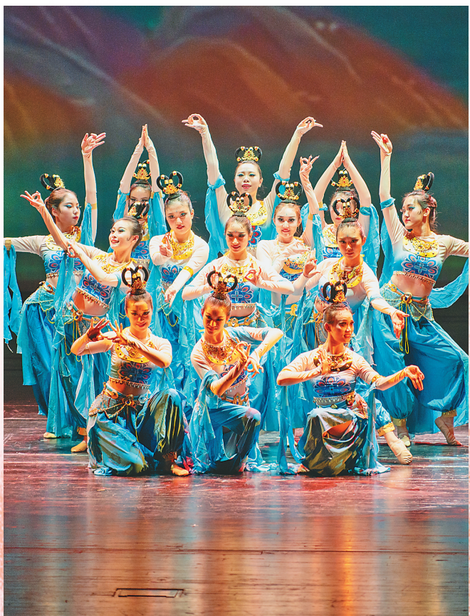
省级集中展演作品《问天》。