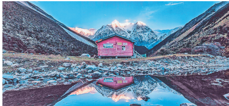
黑河学院摄影作品《天上人间》。

“感谢这个圆梦的舞台!”“这才是青春该有的样子!”这场“为青春喝彩,为梦想高歌”的“大艺展”,如潮的好评背后,是我省高校艺术教育改革的不断探索与实践。