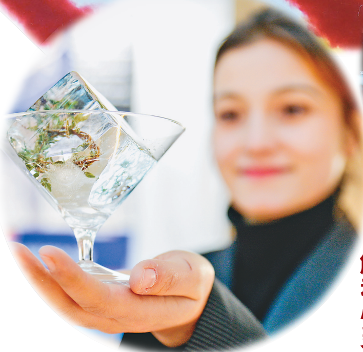
哈尔滨工程大学“冰雪艺术工作坊”透明冰系列产品。