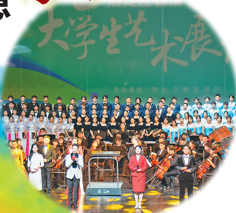
黑龙江省第七届大学生艺术展演现场。