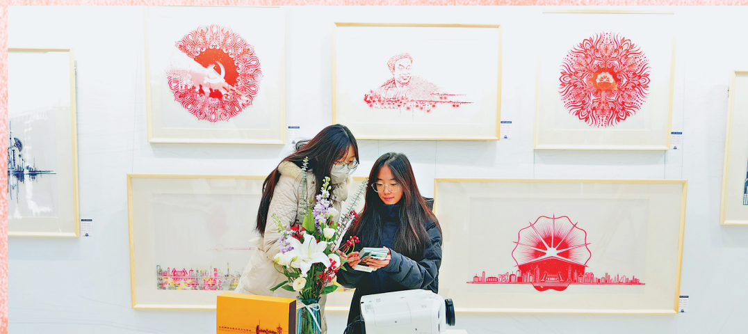
“大庆精神”主题非遗文化剪纸工作坊剪纸作品。