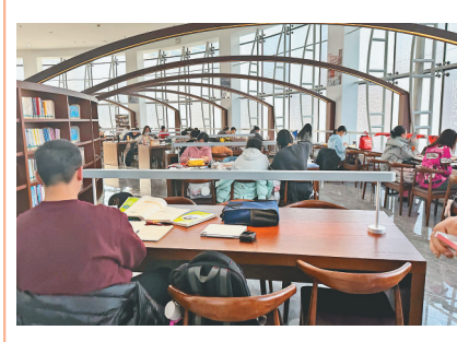
室外,冰天雪地;室内,暖意融融。连日来,省图书馆读者新空间宽敞的大厅内读者众多。读者新空间于9日正式对外开放,随着寒假的到来,许多学生前来“尝鲜”,日均读者达千余人次。 本报记者 董云平撰