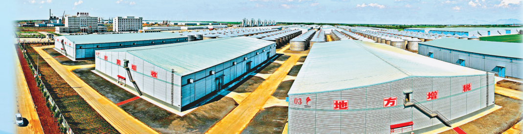
象屿金谷农产仓储区。