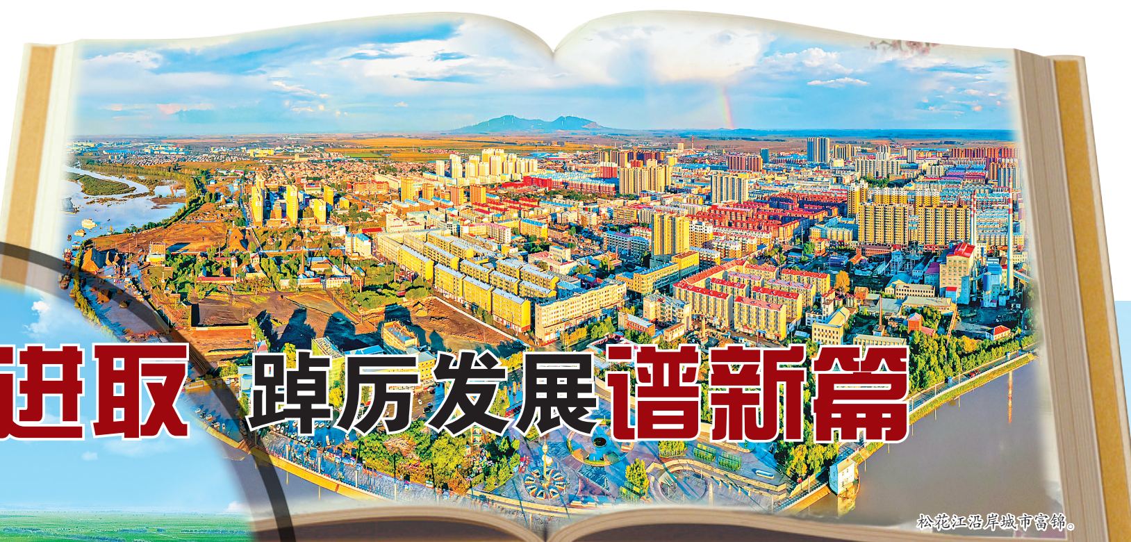
松花江沿岸城市富锦。