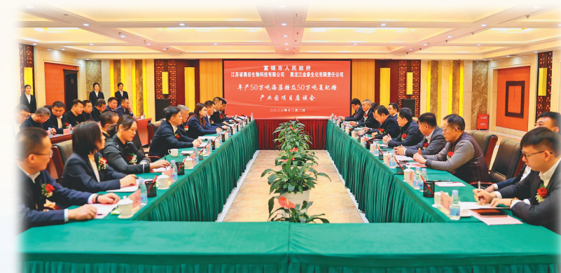
富锦市海藻糖项目签约现场。

富锦市坚持把学懂弄通做实习近平新时代中国特色社会主义思想作为首要政治任务,深入开展主题教育,严格落实“第一议题”制度,市委理论学习中心组进行集体学习14次,示范带动全市各级党组织进行集体学习800余次,深刻领悟“两个确立”的决定性意义,坚决做到“两个维护”,坚定不移用党的创新理论武装头脑、凝心铸魂。为严格履行全面从严治党主体责任,富锦市制发《党委(党组)全面从严治党主体责任年度履职项目指引清单》,层层签字背书,压实责任链条。实施示范建设提质增效行动,4000余名党员干部下沉网格送服务上门,进一步密切了党群、干群关系,南岗社区党委、大屯村党支部被评为“全省标杆型基层党组织示范点”。为有效激发队伍活力,富锦市坚持新时代好干部标准,优化“选育管用”工作,提拔重用优秀干部54人,晋升职级89人,有效激发队伍活力。深入实施“才聚三江”行动,引进乡村振兴、教育卫生等重点领域急需紧缺人才459名,兑现人才补贴223万元,为富锦市高质量发展集聚了人才动能,全市爱才敬贤的氛围更加浓厚,构建了“近者悦而尽才,远者望风而慕”的新时代人才集聚高地,谱写了美好富锦的华彩篇章。风劲正是扬帆时,奋楫逐浪启新程。站在新时代的潮头,富锦市将继续以习近平总书记重要讲话重要指示精神引领航向,真抓实干、锐意进取,深入实施工业强市、农业立市、改革活市、创城靓市、生态育市、依法治市、惠民兴市“七大工程”,奋力谱写新篇章,在高质量跨越式发展的道路上,一往无前、激流勇进,推动富锦市县域经济在新的历史起点上再创辉煌、再攀新高。