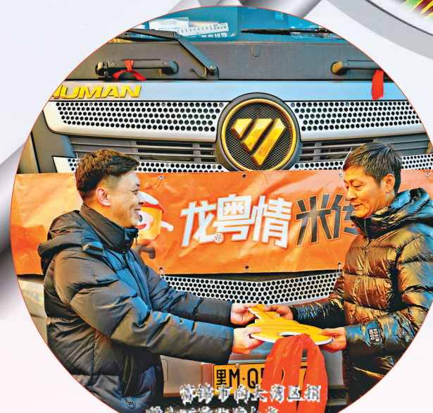
富锦市向大湾区捐赠十万吨大米。