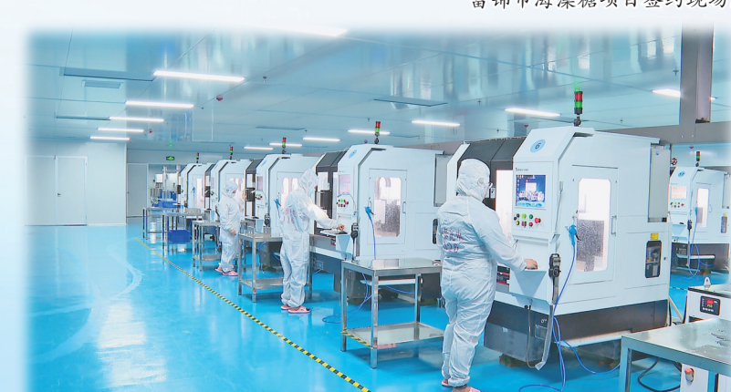
富锦市锦泰光电生产车间。