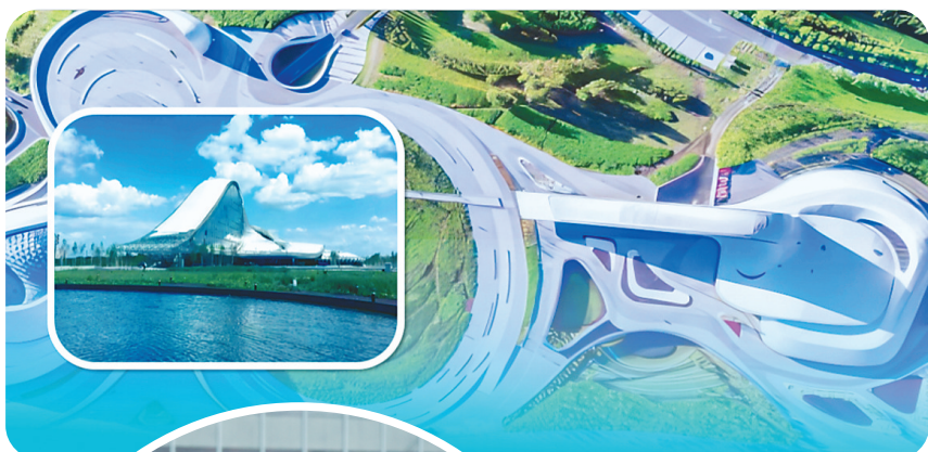
↑哈尔滨示范区总部基地示意图。

高光时刻下的哈尔滨再添“国际范儿”:日前在哈市召开的中国—上海合作组织示范区融合发展圆桌会议上,四家示范区(基地、试验区)签署推动产业深度融合发展合作协议,青岛、杨凌、防城港、哈尔滨四地开启了在上合组织框架下的紧密联动,优势互补、互利共赢,助力构筑我国对外开放新高地。“哈尔滨的冰雪优势将辐射整个上合组织。”上海合作组织秘书长张明对最新入列的哈尔滨充满期待。