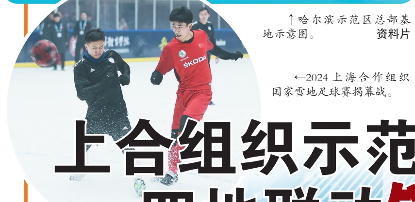
←2024上海合作组织国家雪地足球赛揭幕战。