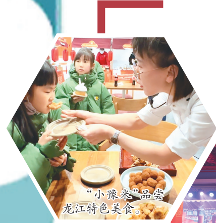
非遗传承人与小朋友互动吹糖人