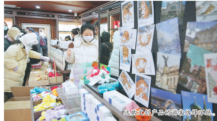
选购文创产品的游客络绎不绝。