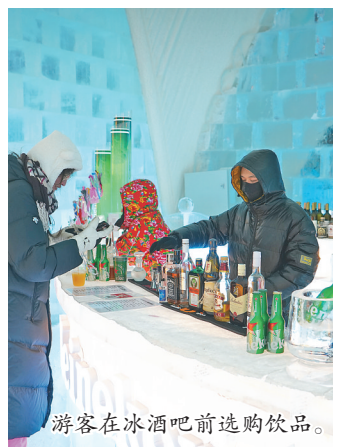
游客在冰酒吧前选购饮品。

制成，是由哈工大团队研发的试验品，能够有效锁住水分，避免溶解。此外，在屋顶上设有十多个小烟囱，可供40人在冰屋内同时享用火锅。游客朋友们可以在全冰的环境中，拿着冰酒杯开怀畅饮，吃着火锅感受冰火两重天；听着动听的音乐，在冰床上入睡，体验全套服务，获得丰富的游玩体验。