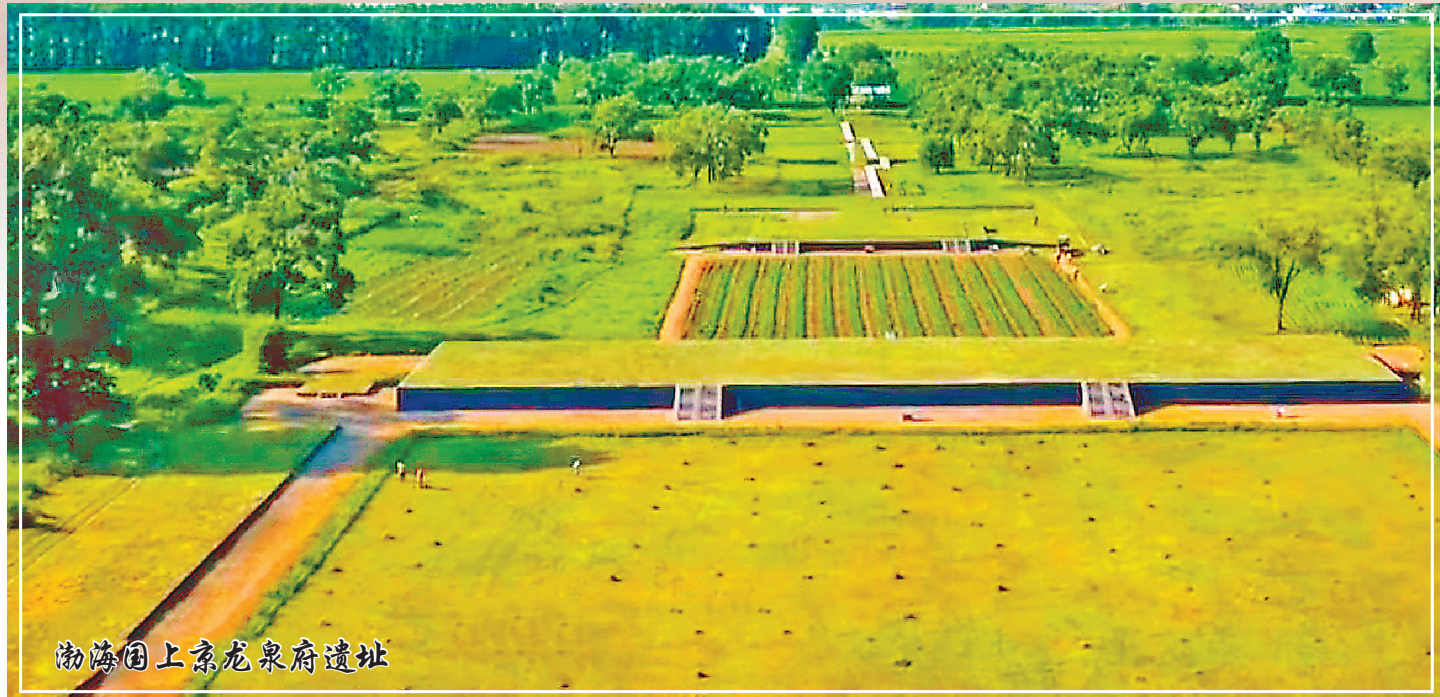
渤海国上京龙泉府遗址