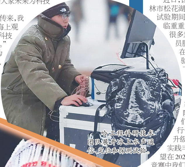
哈工程科研人员团队展开水上声通信、定位和探测试验。

“当巨大的轰鸣声传来,我心潮澎湃,倍感骄傲,海上观礼让我们亲眼见证了科技强国建设的‘硬实力’。”学子们纷纷表示,作为一名哈工大人,未来也要发挥专业特长矢志航天报国。