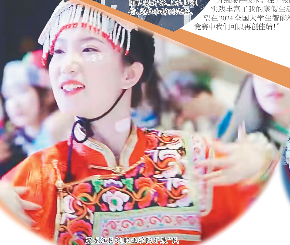
黑龙江民族职业学院开展“民族+”系列艺术实践活动。