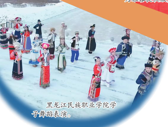
黑龙江民族职业学院学子舞蹈表演。

近日,哈尔滨音乐学院青年志愿者学生走进哈尔滨火车站举办了“三场车站迷你音乐会”,用专业的表演技能彰显了音乐之城哈尔滨的独特风情与青春活力。在哈尔滨音乐学院“冰雪遇见音乐·我为龙江代言”主题青年志愿服务系列活动的专场演出中,该校管弦系和民族声乐系的师生为车站的游客表演了《我心永恒》《记忆中的你》《此情不移》等多首曲目。萨克斯合奏《节日》和《北国之春》用旋律让游客朋友感受到了北方音乐之城的魅力所在。女声独唱《灯火里的中国》引发现场观众轻声跟唱,来自祖国各地的游客共同点燃“南北一家亲”的情怀。