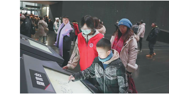
哈工程学子忙备赛。