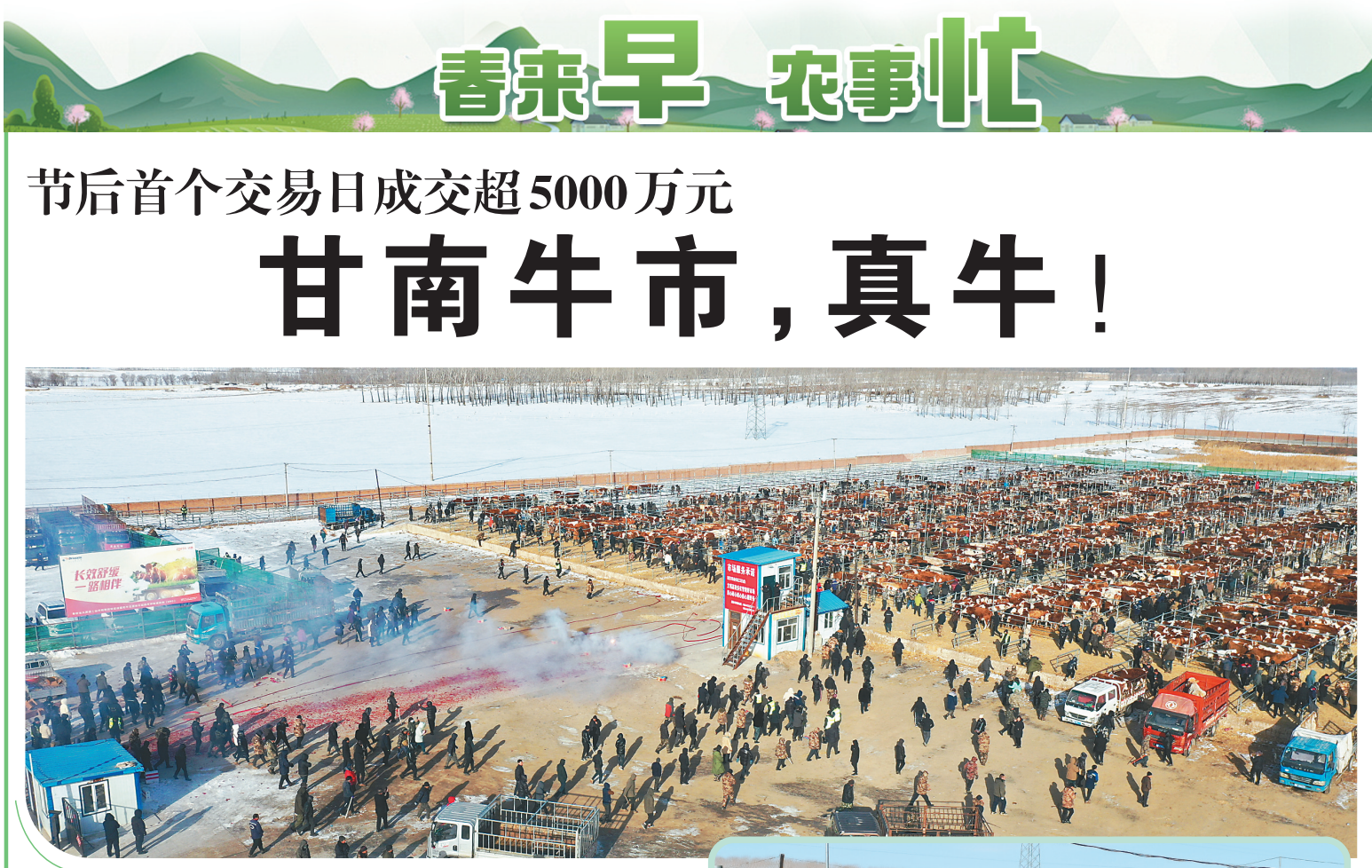
养殖户和客商涌入交易场地。

本报讯(李文浩 张强 于丁 记者孙昊)25日,甘南县欢喜牲畜交易市场迎来春节后首个交易日,总计成交量5000头(匹),成交额超5000万元,开市首日迎来“开门红”。 作为目前东北地区交易品种最全、交易数量最大、覆盖范围最广的现代化“一站式”牲畜交易市场,“甘南牛市”吸引了来自全国各地的大量养殖户和客商汇集于此。 “8点半入场,不到40分钟就卖了一头牛,以6800元成交的。”欢喜村农民高成养了近30头牛,依托家门口的牲畜交易市场,售卖十分方便,每年靠养牛能获得10余万元的