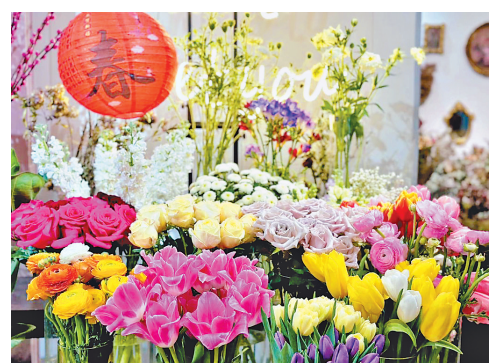
□文/摄 本报记者 韩丽平

近日,记者走访哈尔滨多家商场看到,不少商家大张旗鼓提前开启以“女神节”为主题的大促活动,助推“她经济”,进一步释放节日消费潜力。