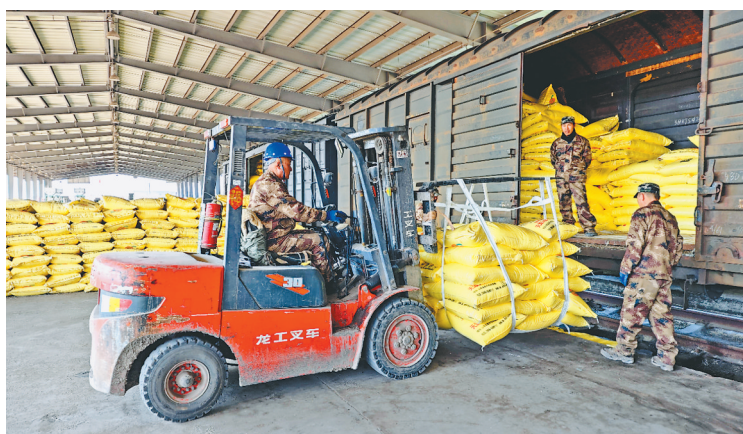
一袋袋农资被装上列车。

为提高农资运输效率,哈尔滨局集团公司发挥中国铁路95306电子商务平台“一站式”服务优势,建立“调度、运输、货运、营销”运输一体化工作机制,遇有运力紧张、化肥卸车困难等情况,可及时调配空车、装卸机具等,优先保障春耕物资运输。