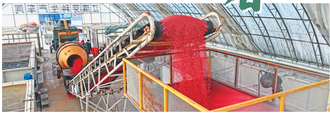
生产线上进行水稻种子包衣作业。

为保证春耕春播工作顺利进行,江滨分公司加强农机检修工作。各管理区根据种植业结构调整,结合本单位的实际情况,将农机检修和机具改造工作有机结合起来。农机检修严格遵守技术操作规程,把好技术关,确保检修质量。江滨分公司从3月4日就开始进行水稻种子包衣工作。为了确保种子包衣、浸种质量,分公司专门聘请种衣剂厂家专业技术人员全程进行技术指导,按照种子包衣注意事项,严格控制药、种、水的比例,规范种子包衣流程,确保种子100%包衣,切实提高种子发芽率及抗病、抗