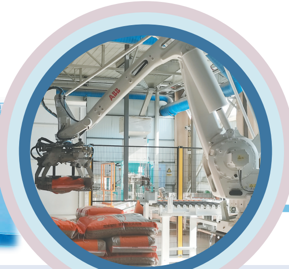
种子进行码袋。