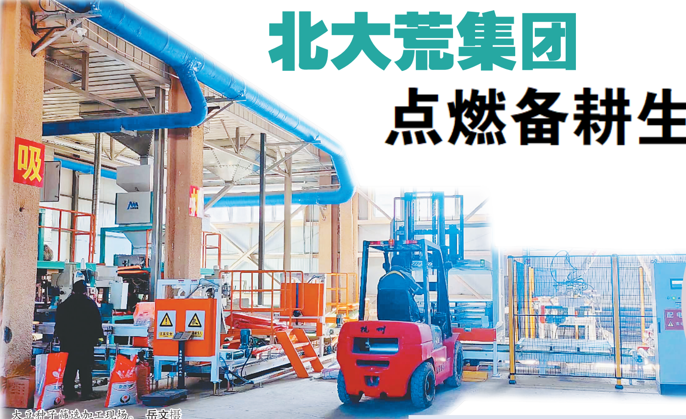
大豆种子筛选加工现场。