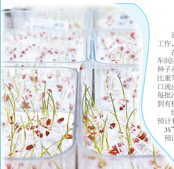
种子发芽实验。

力、秧苗素质、成本等因素综合考虑对育秧基质进行配方式的改良,配制出的多种能有效代替泥土的育秧基质土,成了藏在农田里的新机遇。这种育秧基质土,不但可以降低土壤比重,提高蓄水保水及透气能力,还能解决秧田取土难、质量差等问题。目前,北大荒集团建三江分公司通过不断探索创新开发出22项可复制、可推广的农业新技术,真正实现“藏粮于地、藏粮于技”,孕育黑土地的无限“粮”机。