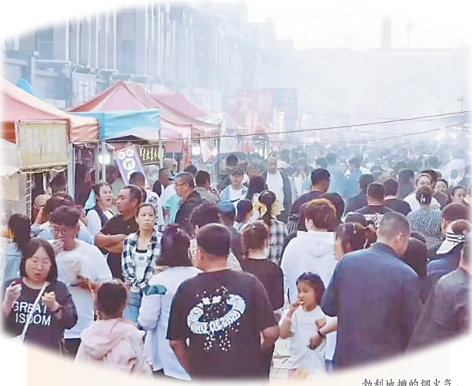
勃利地摊的烟火气。