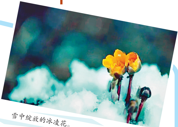
雪中绽放的冰凌花。

据有关资料记载:冰凌花含有强心甙和非强心甙的多种成分,它具有强心、利尿、镇静及减慢心率的功能,能降低神经系统的兴奋性和脊髓反射机能亢进,用于急性病和慢性心功能不全。主治充血性心力衰竭、心脏性水肿和心房纤维性颤动,与溴化银的合用能加强对癫痫病的治疗作用。