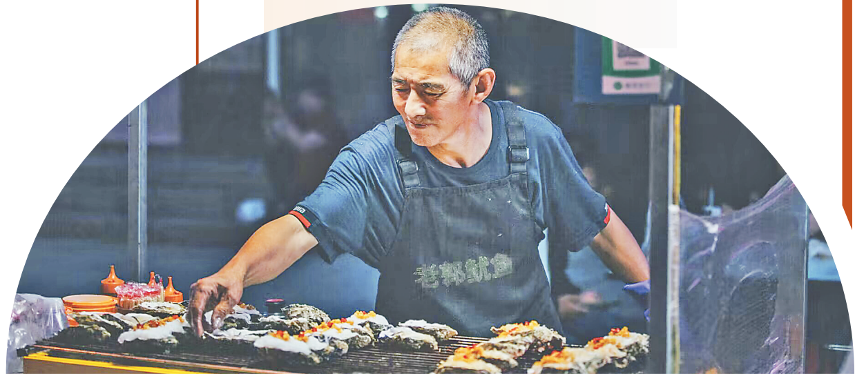
正在烤生蚝的商家。

有人说,天上飞的、地上跑的、水里游的、山上生的、地上长的,只要人能吃都能成为地摊美食。聪慧的勃利人万物皆可烧烤。不吃山珍海味,不吃名贵大餐,不吃东北特产,就吃特色地摊,一饱口福,勃利地摊理所当然成为首选。