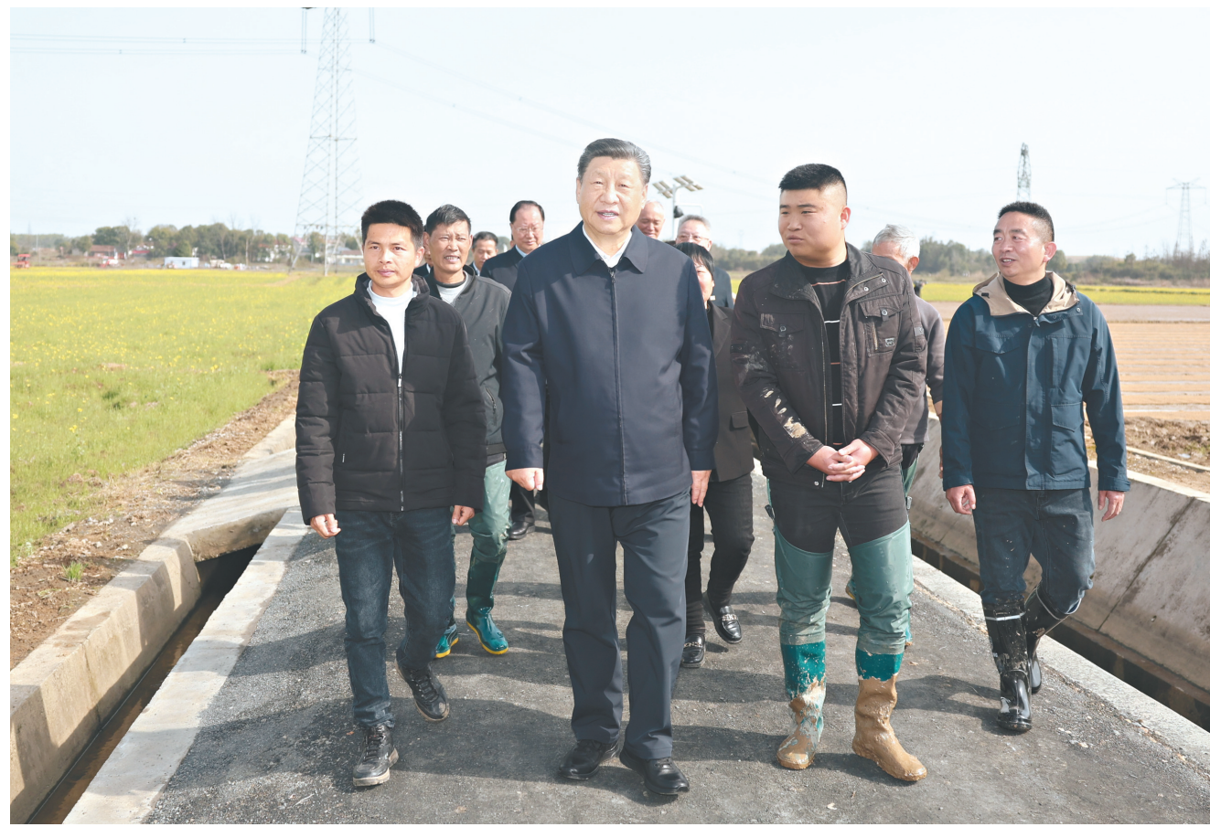
3月18日至21日，中共中央总书记、国家主席、中央军委主席习近平在湖南考察。这是19日下午，习近平在常德市鼎城区谢家铺镇港中坪村，同种粮大户、农技人员、基层干部亲切交流。新华社记者 鞠鹏摄

随后，习近平来到巴斯夫杉杉电池材料有限公司考察。这是一家主营锂离子电池正极材料研发、生产和销售的中德合资企业。习近平听取当地加快发展新质生产力、扩大高水平对外开放等情况介绍，察看企业产品展示，了解材料性能测试情况和电池生产流程。他强调，科技创新、高质量发展是企业不断成长壮大、立于不败之地的关键所在，民营企业、合资企业在这方面都可以大有作为。中国开放的大门会越开越大，我们愿意同世界各