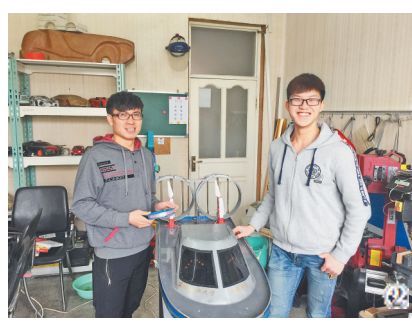
坚持产教融合 明晰发展新质生产力的靶向性 学院面向机械行业及区域发展，加大科研投入的同时，不断增强产教融合力度，发挥科技创新助力人才培养

功能。一方面，以产教融合为主线，以支持引领行业创新发展为导向，依托学校农林行业的学科优势及森林工程、林木机械、智能装备等领域的深厚积淀，建设专业课程集群，以提升农林装备数字化、智能化、现代化水平为目标，获批“农林智能装备工程”本科专业(全国首次设置)，助力新质生产力高质量发展。另一方面，以科教融汇为驱动，借助教师科研项目及企业实践基地，通过课内实践、专业实习、拓展任务、双创活动等形式，强化学生工程实践能力的培养。实现了专业课程产学研用一体化高质量发展。