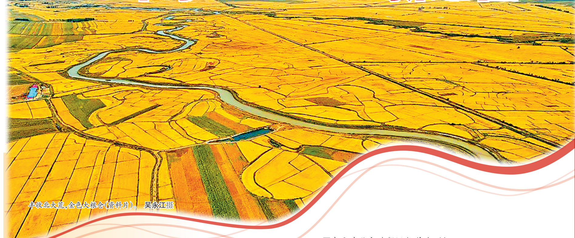
丰收北大荒,金色大粮仓(资料片)