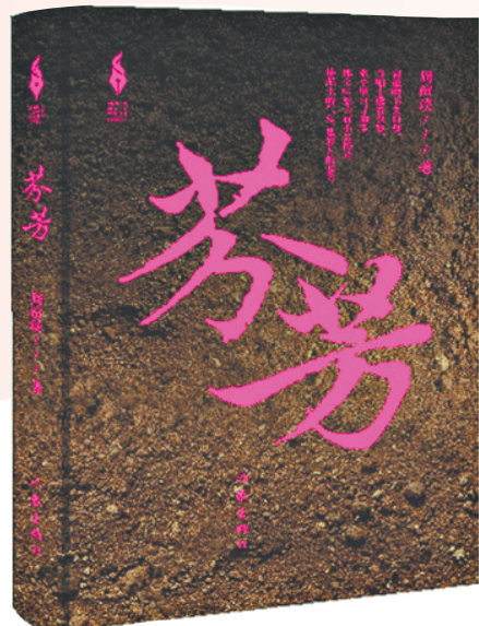
《芬芳》周瑄璞作家出版社2023年10月

感谢作家，让我们从众多女性的苦难中，读出了生命给予的反省和启发，应该怎样活出自己的样子，过完一生，想必读者会有不同的答案。