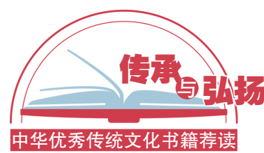
中华优秀传统文化书籍荐读