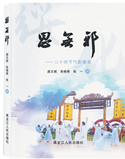
《思无邪——二十四节气影像录》/ 庞文斌 张晓舜 张一/黑龙江人民出版社/2023年9月

去年国庆到北京观复博物馆一游，拾级上二楼，映入眼帘的是以丝绸打印文字与图片的方式进行着的二十四节气展览，唯美、生动，引人入胜。黑龙江人民出版社新鲜出炉的《思无邪——二十四节气影像录》，亦以图文并茂方式言说二十四节气、七十二物候，与观复博物馆创办人、收藏家马未都传播中华传统文化的用心与方式多有契合，呈现效果亦佳，值得称赞。