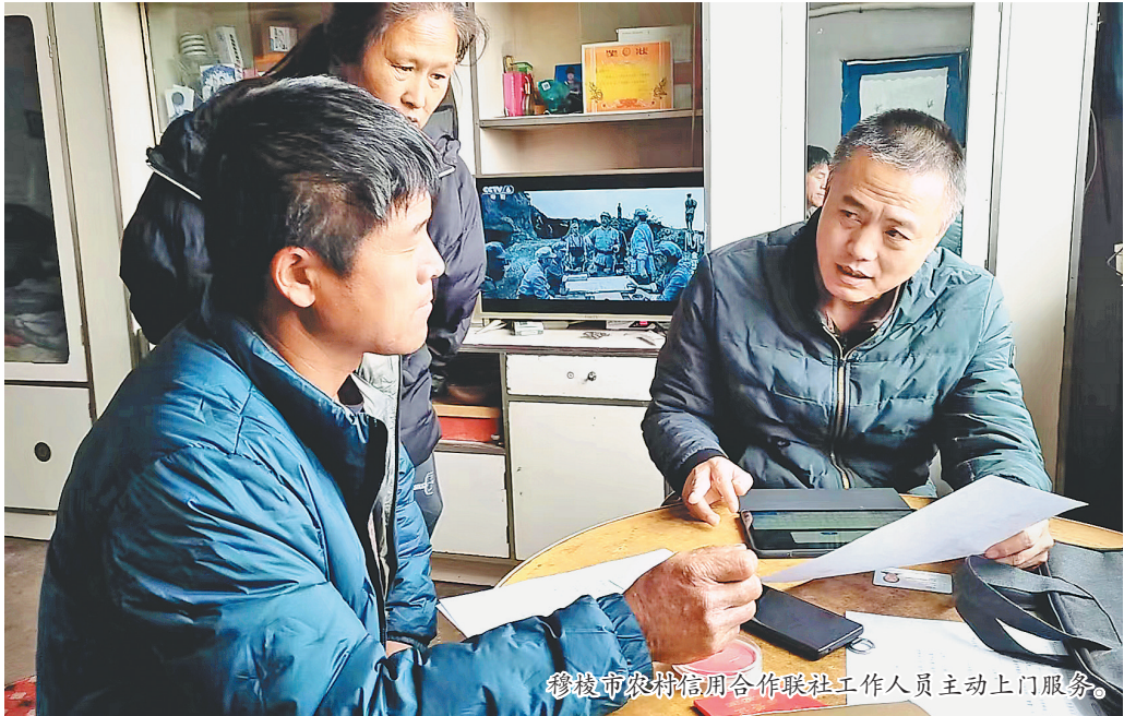
穆棱市农村信用合作联社工作人员主动上门服务。

记者从穆棱市农业农村局获悉,今年他们提前部署,积极协调动员农资经营户储备种子、化肥、农药等农用物资,确保农资充足供应。“我们刚召开了2024年度农机检验工作启动会议,组织农机监理技术人员分成7个检验小组深入全市8个乡镇,对农机进行实地免费检验。”穆棱市农业农村局工作人员介绍说。