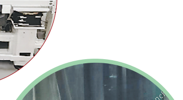
哈工大研发的精密检测设备。