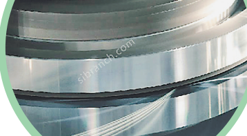
哈工大研发生产的超精密机床。