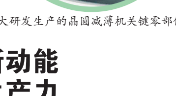
哈工大研发生产的晶圆减薄机关键零部件。