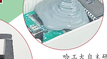
哈工大自主研发的灌封胶产品。