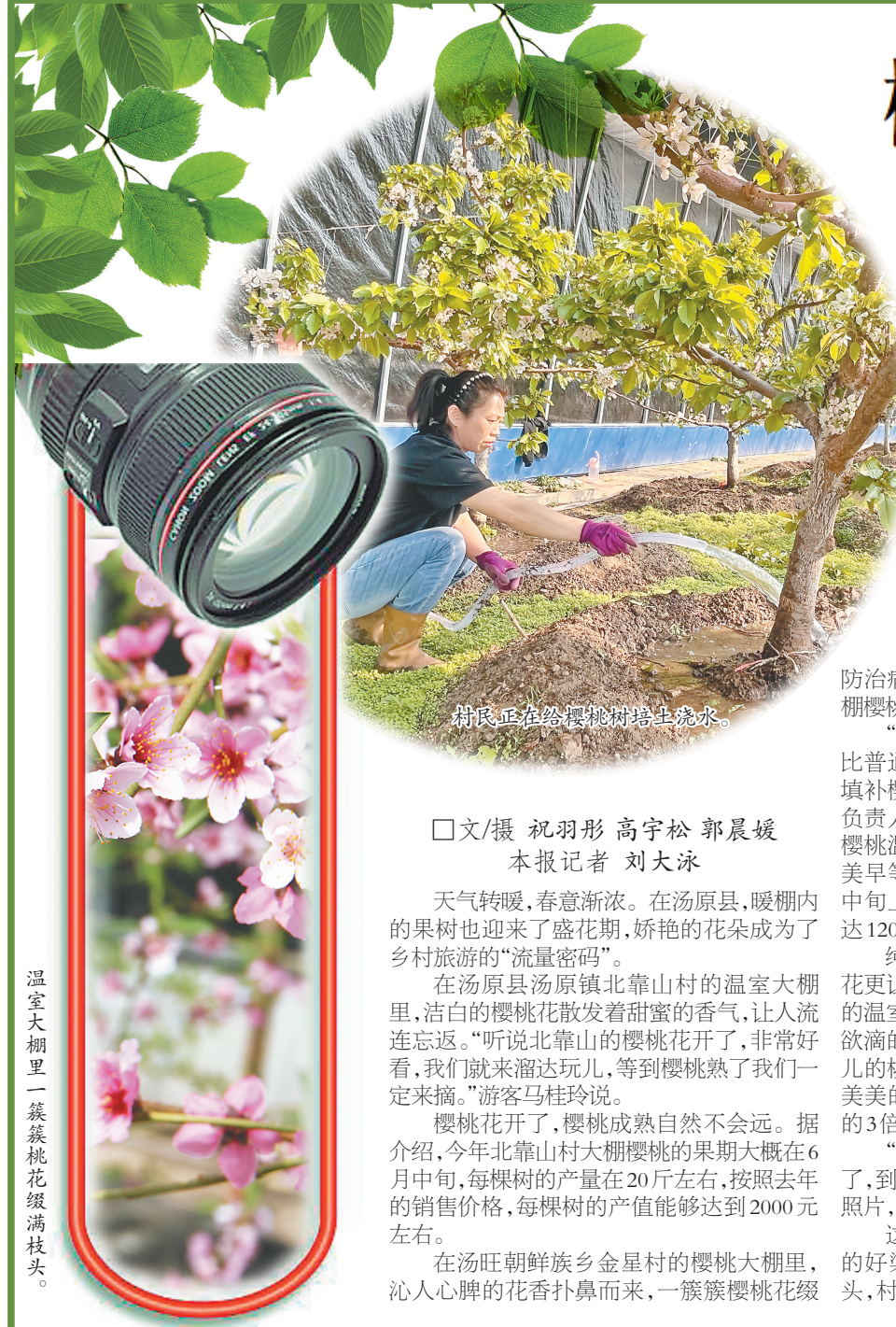
村民正在给樱桃树培土浇水。