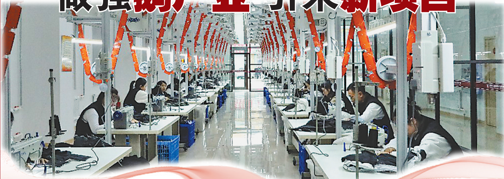
“鹅司令”羽绒服生产车间。