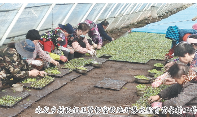
永安乡村民们正紧张忙碌地开展水稻育苗春耕工作。