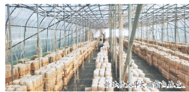
新建村木耳园区于2017年投产使用，园区占地面积3万平方米，建有大棚38栋，配套设施完善，管理房、水泵、配电箱等设备设施一应俱全，可投放黑木耳菌包75万袋，产出干黑木耳9万余斤。除经济效益可观外，基地动员周围群众积极参与木耳菌棒杀菌、打孔、吊袋、地摆、晾晒等工作，就近就地就业，有效增加农民收入，进入采摘期可带动70余人务工，真正让村民实现家门口增收。