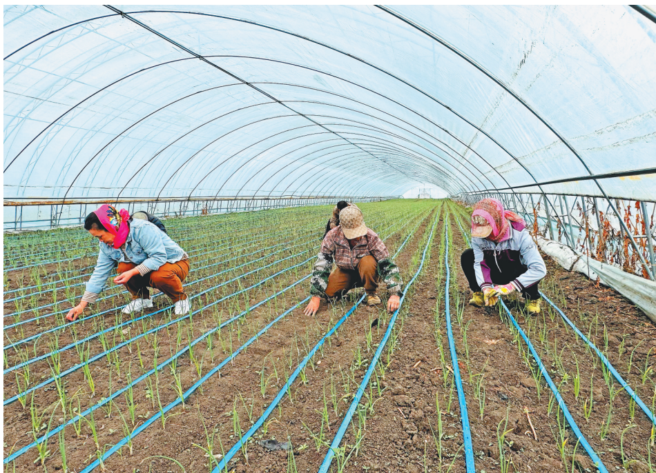
工人们正在洋葱大棚内除草。

近年来,集贤县聚焦“2+6+N”产业集群,紧紧围绕“服务城市、保障城市、富裕农民”目标,以市场需求为导向,以提质增效为基础,大力推进农业种植结构战略性调整,积极鼓励百姓发展设施农业,让农民转方式、调结构,实现“种有定向、销有方向”。