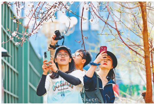
4月22日，哈尔滨市道里区柳树街杏花盛开，美丽的景色吸引了许多市民和游客驻足观赏、拍照留念。