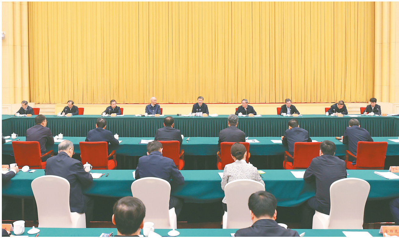
4月23日下午，中共中央总书记、国家主席、中央军委主席习近平在重庆主持召开新时代推动西部大开发座谈会并发表重要讲话。

习近平强调，要坚持把发展特色优势产业作为主攻方向，因地制宜发展新兴产业，加快西部地区产业转型升级。强化科技创新和产业创新深度融合，积极培养引进用好高层次人才，努力攻克一批关键核心技术。深化东中西部科技创