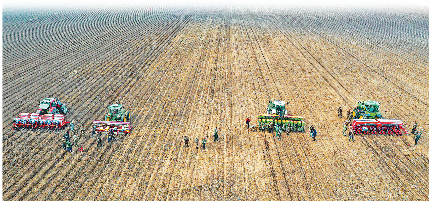
4月21日,在黑龙江北大荒农业股份有限公司友谊分公司第五管理区第二作业站玉米播种现场,四台机车一字排开,进行播种作业。近日,“大粮仓”黑龙江垦区玉米播种全面展开,北大荒有耕地4600余万亩,综合机械化率99.7%。北大荒农业股份友谊分公司今年种植玉米81万亩,在机械化、智能化的强力支撑下,作业进度快、效率高,有效提高了春耕生产的质量与进度。