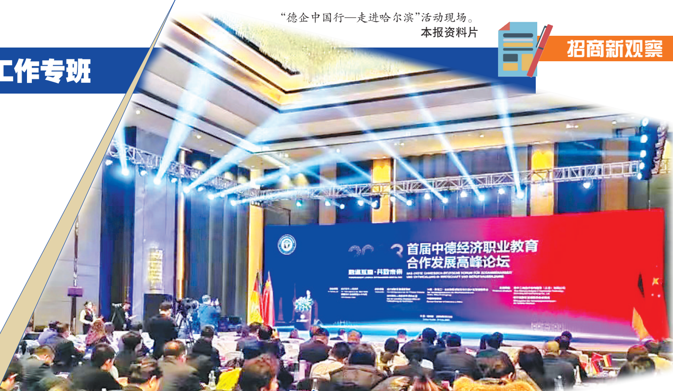
“德企中国行—走进哈尔滨”活动现场。本报资料片

我省平台经济项目招商工作专班马不停蹄,认真贯彻落实省委省政府“大招商、招大商”的工作要求,积极搭建招商平台,举办招商主题活动,通过大型活动营造氛围、推介宣传、对接项目,一批大项目、好项目纷纷落地。