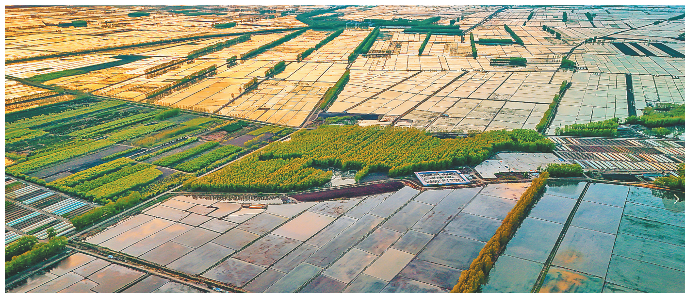
手把青秧插满田,低头便见水中天。五月的北大荒美得让人沉醉……夕阳下,俯瞰北大荒集团江川农场有限公司的水田,像一面波光粼粼的镜子……静待插秧,静待秧苗的生长,静待秋天的一片金黄。