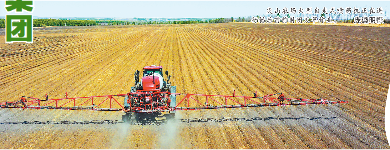
尖山农场大型自走式喷药机正在进行播后苗前封闭灭草作业。