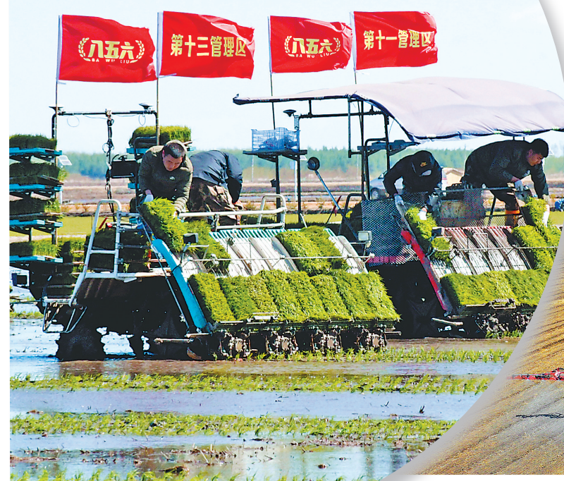
插秧现场。