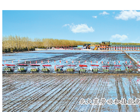
北大荒劳动和技能竞赛(春季)在八五〇农场有限公司举行。

赛前与会人员进行现场连线的方式,观摩了八五六农场劳动竞赛现场,观看了八五四、八五五、八五七、八五八和宁安农场5个分现场春耕劳动竞赛情况,各分现场从全国“金豆王”大豆播种作业、全国大豆良种繁育基地育种状况、水稻种植数字化管控、农业技术人员技能比拼、新型智慧农机展示、马铃薯高产高效栽培模式等进行展示,重点展现牡丹江分公司以建设高标准农田、高产示范田和智慧农业示范基地为契机,培育发展农业领域新质生产力,持续巩固提升现代农业发展质量与水平的新实践、新成果。