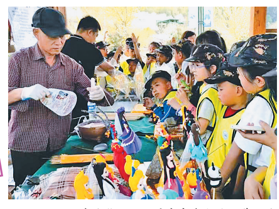
亚布力熊猫馆开展丰富多彩的研学活动。

在原始森林中“洗肺”，在特色林场(所)中放松，在郁郁林间穿行……游客纷至沓来，徜徉在绿水青山之间，探寻自然之美。龙江森工集团658万公顷绿水青山释放出生态旅游新动能。