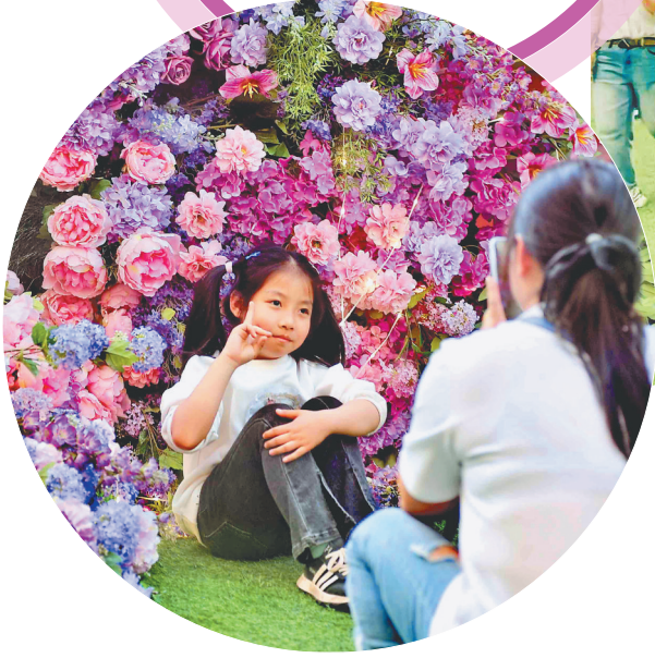
游客在“魔法花园”里拍照。

近日，作为哈尔滨城市名片的中央大街精心营造一步一景，为“尔滨”旅游在服务项目、服务细节上“加分”，吸引八方游客。别致的环境、多彩的演绎、精致的美食使百年老街再成“流量王”，游客和市民放慢脚步，沉浸式打卡“亚洲第一街”。