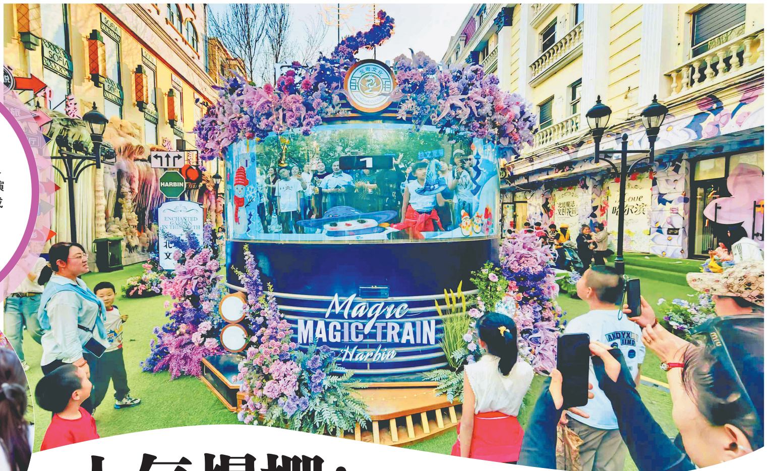
中央大街“魔法花园”里的互动游戏。