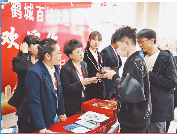
鹤城百校大宣讲活动现场。

坚持厚植留才沃土,建立领导干部包联制度。 开展“万名干部进万企敲门行动”,358名领导干部覆盖全县“5上”企业、小微企业等336户市场主体,解决实际问题120项。优化完善配套服务措施,搭建大学生实习实训后勤保障基地、红色教育基地、大学生联合培养基地,累计吸纳清华大学、北京大学等近百所高校3000余名师生参与乡村振兴课题研究。优选59名人才服务专员,切实帮助人才解决住房、医疗、配偶安置、子女就学等“关键小事”。运用广播电视、微信公众号、短视频平台等渠道,弘扬人才发展优先理念,解读人才政策,在全社会营造尊重人才、尊重知识、尊重创造的良好氛围。