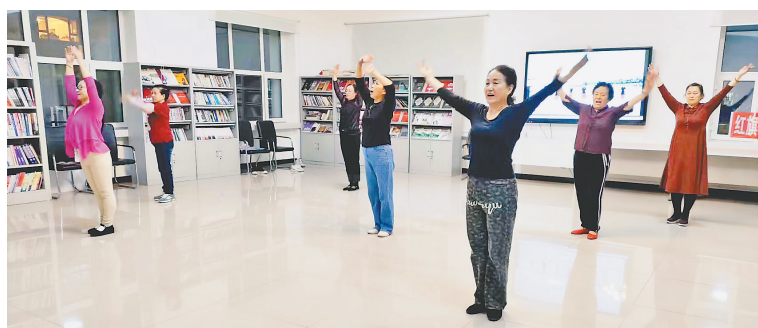
社区居民在“红旗夜校”学舞蹈。