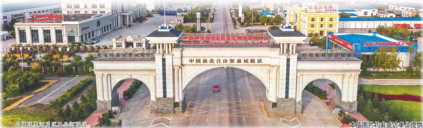
自贸区黑河片区二公河园区。

未来,自贸区黑河片区将全面贯彻落实“构筑我国向北开放新高地”目标,锚定国家赋予的功能定位,实现高水平高质量发展。期待与各方有识之士携手,共享自贸区发展红利,共创互惠共赢新未来!