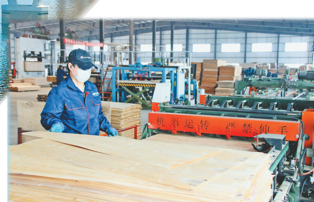
通过中欧班列进口的桦木单板在加工中。