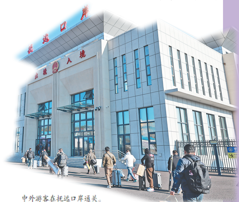
中外游客在抚远口岸通关。