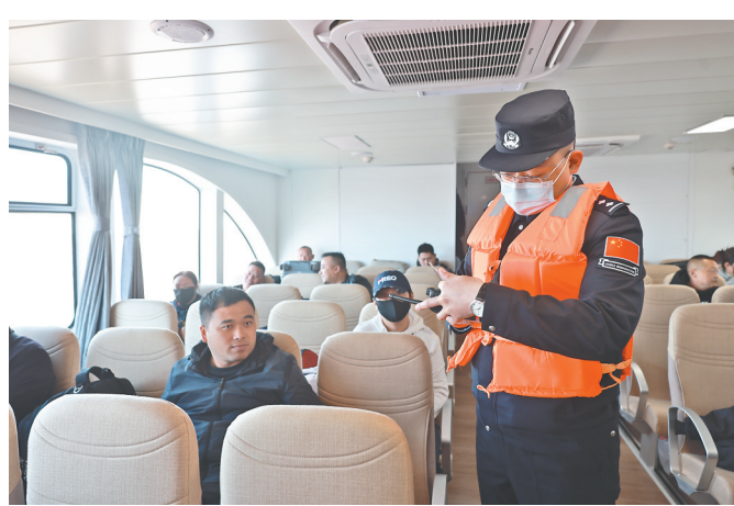
抚远边检工作人员查验游客证件。