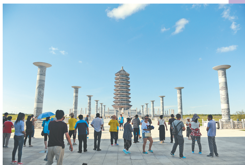
黑瞎子岛东极宝塔游人如织。

相关部门表示，今年全面实施进出口货物“提前申报”、全域推行“船边直提”“抵港直装”模式，开辟口岸通关绿色通道，实现业务最大限度网上办理、口岸24小时通关，确保口岸效能充分释放。