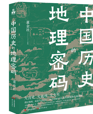
《中国历史的地理密码》/董金社/ 现代出版社/2023年10月

“历史的盛衰与王朝更迭,气候是看不见的操盘手。”竺可桢先生绘制了中国历史时期的气温波动曲线,揭示了历史与地理环境之间的共生关系——气候冷暖与族群和王朝兴衰确有关系。“12世纪刚结束,杭州冬温回暖。公元1200年、1213年、1216年、1220年,杭州无任何冰和雪。”此温暖期,成吉思汗迅速崛起。但不久严寒又来。1329年和1353年,太湖结冰,厚达数尺。另据研究表明,元中期以后气温不断下降,此时农民军起义,掀起狂飙,元帝国因之轰然倒塌。1644年,是中国历史上平均气温最低的年份。