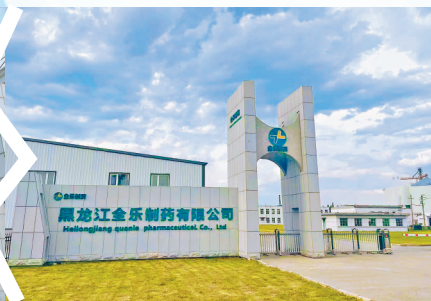
黑龙江金乐制药有限公司。