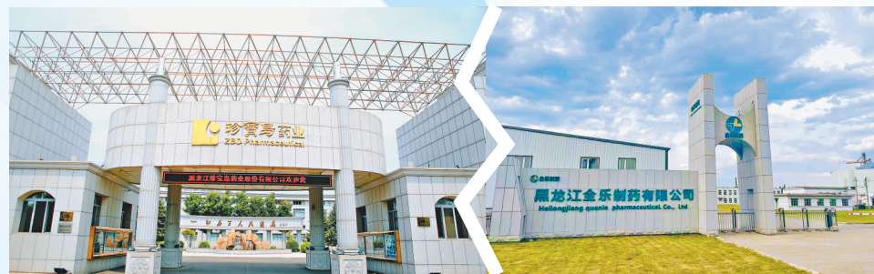
珍宝岛药业厂区整洁而现代。