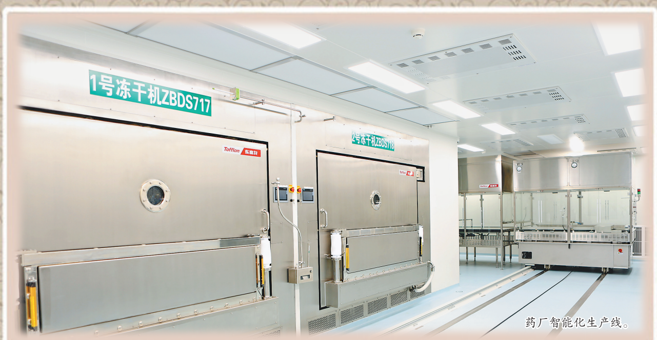
药厂智能化生产线。