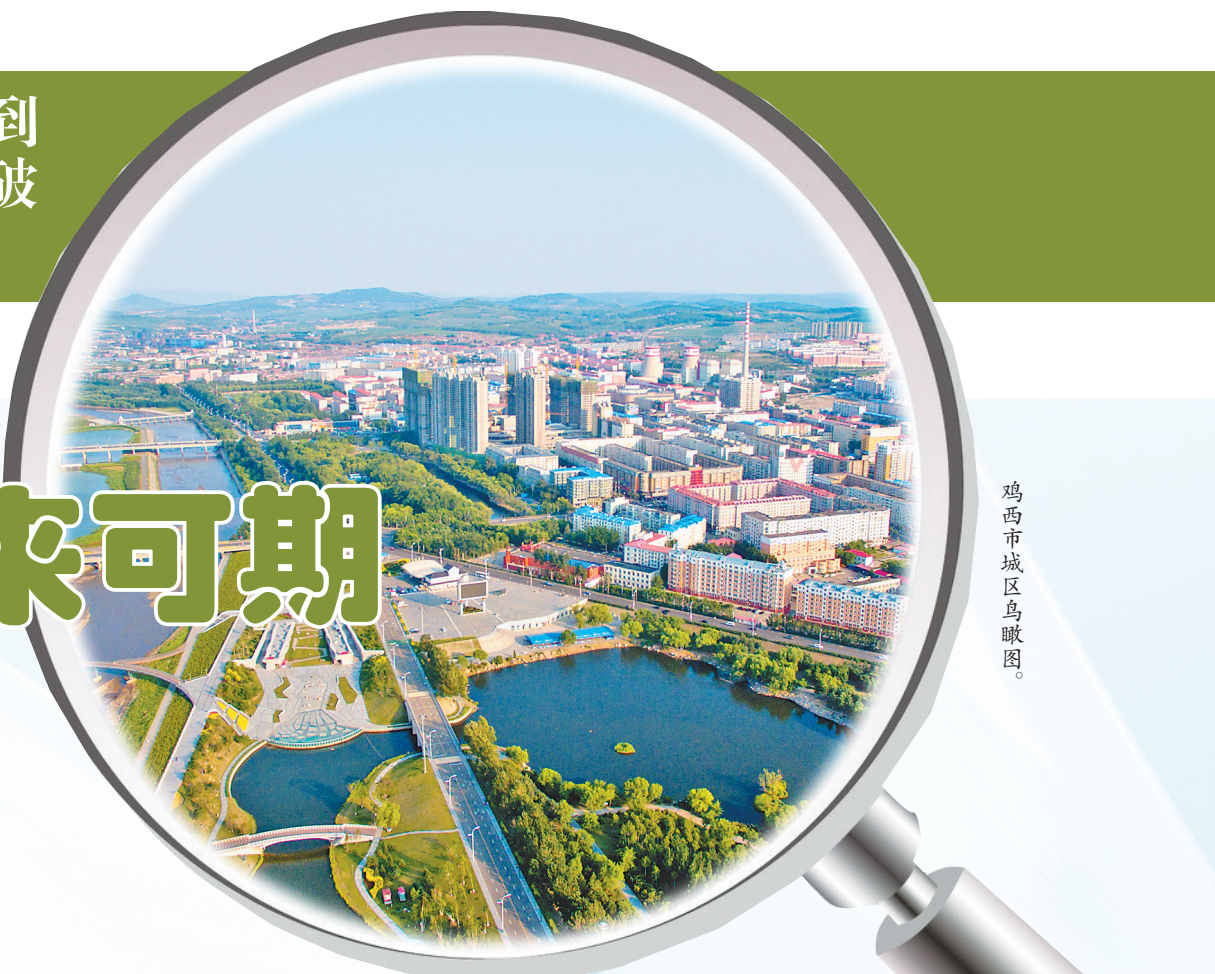
鸡西市城区鸟瞰图。