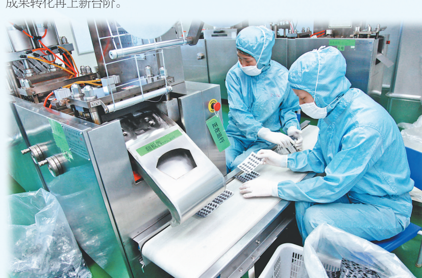
正在运行的生物制药企业生产线。