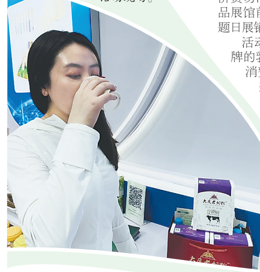
消费者试喝大庆奶粉。