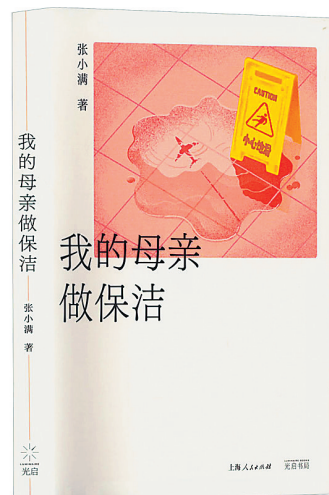
《我的母亲做保洁》/张小满/上海光启书局/2023年11月

读张小满的《我的母亲做保洁》这本书，我的内心久久不能平静。这本书以平实的语言，生动地描绘了保洁工的生活状态与内心世界。她不是简单的清洁者，而是生活的记录者，是城市角落的守望者。在这本书中，我看到了母亲，看到了自己，也看到了无数个在城市中默默付出的身影。