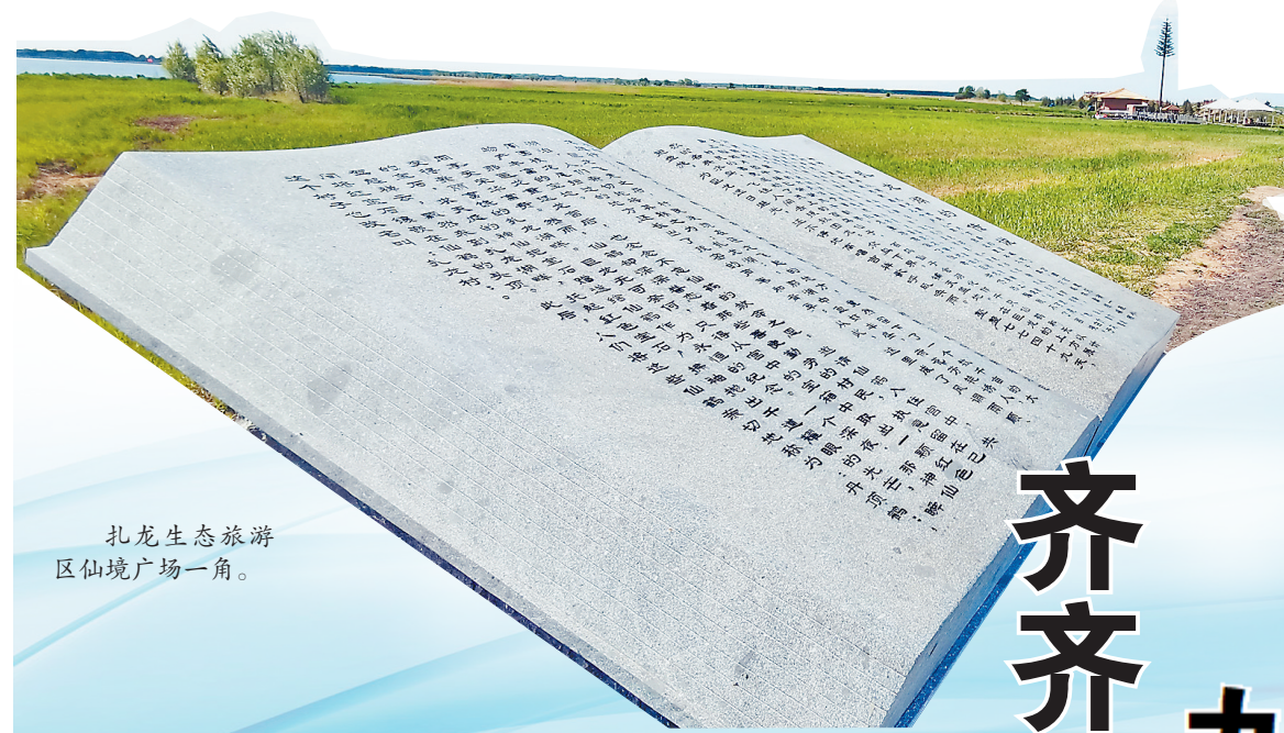
扎龙生态旅游 区仙境广场一角。