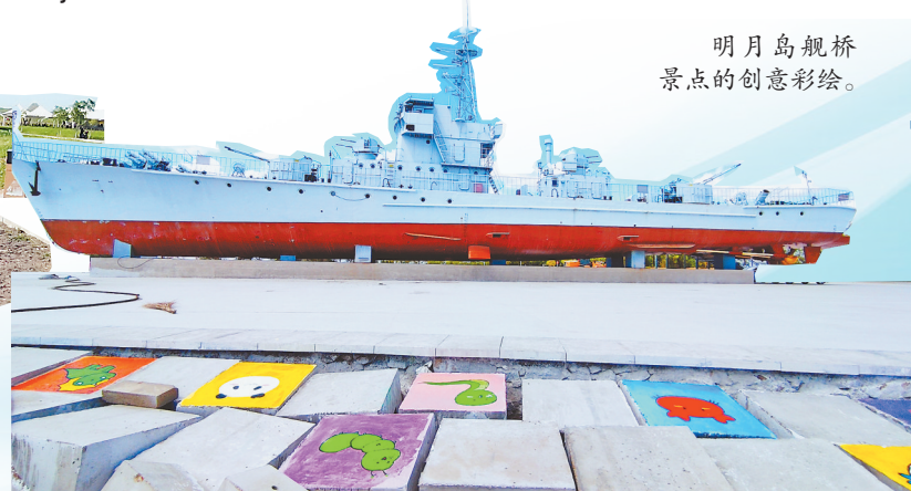
明月岛舰桥 景点的创意彩绘。