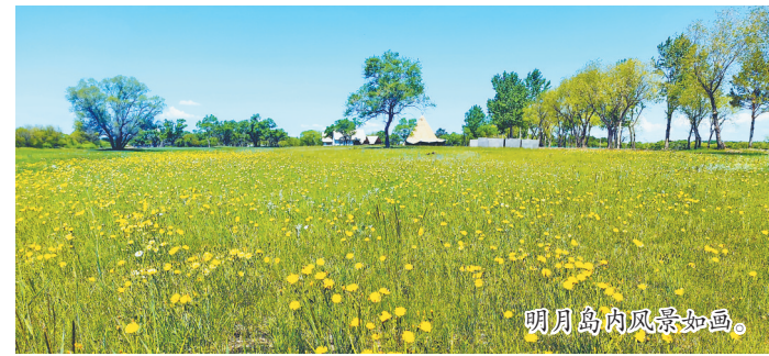
明月岛内风景如画。

新齐齐哈尔烤肉地图小程序,融入住宿、美食、交通等多种产品,让游客“一图在手,游遍鹤城”。据了解,本届旅发大会将在“旅游+科技”“旅游+民俗”“旅游+烤肉”“旅游+体育”“旅游+工业”“旅游+文化”上打造多项活动,使游客到来后,既能体验民俗文化,又能感受科技给生活带来的无限乐趣,也会被烤肉美食之都的浓厚氛围和老工业基地的深厚底蕴深深吸引。