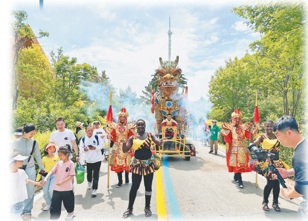
龙沙动植物园花车巡游。

“文旅搭台·经贸唱戏”一直是齐齐哈尔旅游业发展的重要目标之一。在本届旅发大会期间,该市将举办羽绒产业招商引资合作洽谈会、特色旅游商品体验展销、金融专场活动等经贸活动,邀请百余名国内外龙头企业嘉宾走进鹤城、了解鹤城、投资鹤城。开幕式将设有集中签约环节,预计将完成项目签约近40个,签约金额超百亿元,真正实现“办一届大会,兴一座城市”的目标。