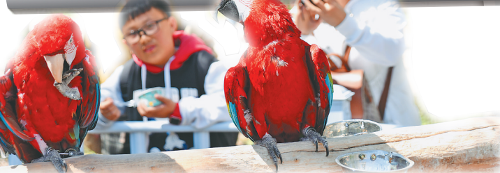
哈尔滨北方森林动物园里的金剛鸚鵡惹人愛。

阿城区素有“女真肇兴地,大金第一都”之称,拥有丰富的历史文化资源,处于哈尔滨“一小时旅游圈”的核心位置。致力于全域全季旅游发展,阿城区通过整合特色资源,深化文旅产业融合,全力打造三餐有味、四季有景的全域旅游目的地。