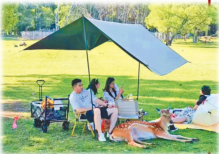
游人在森工平山旅游区露营。

此次义诊活动,九三学社哈尔滨市第一医院支社医护人员以精湛的医疗技术和“以病人为中心”的职业服务理念,不但帮助群众解决了疾病困扰,还与呼兰区老促会结成对子,为3个革命老区村提供长期医疗服务。