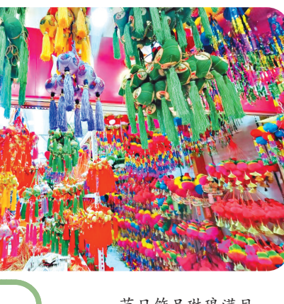
节日饰品琳琅满目。