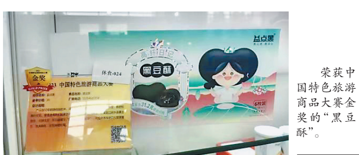
荣获中国特色旅游商品大赛金奖的“黑豆酥”。