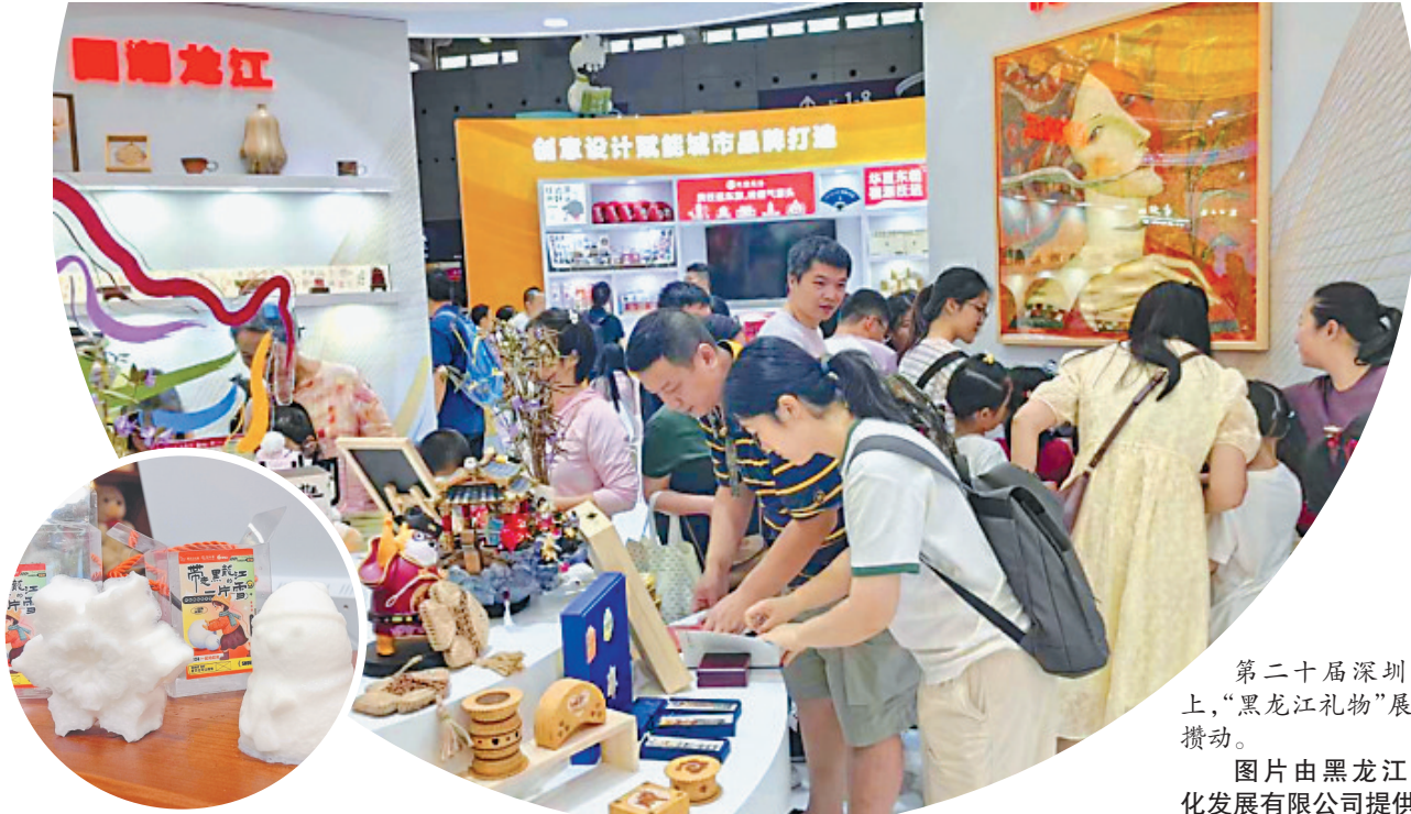
第二十届深圳文博会上,“黑龙江礼物”展区人头攒动。