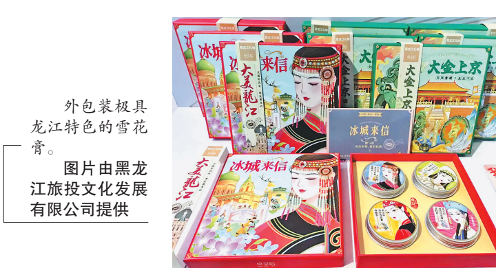
外包装极具龙江特色的雪花膏。