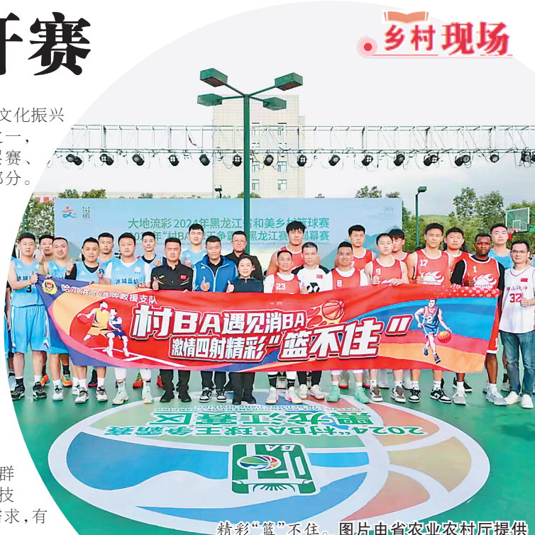
精彩“篮”不住。

本次黑龙江省和美乡村篮球赛是“大地流彩——黑龙江省乡村文化振兴在行动”省级层面重点赛事之一,共包括省级揭幕赛、县级基层赛、市级选拔赛、省级总决赛四部分。省队总决赛由各市(地)、省农垦集团、省森工集团选拔十余支队伍参与角逐,最后胜出的两支代表队将代表黑龙江奔赴贵州参加2024年全国“村BA”球王争霸赛。