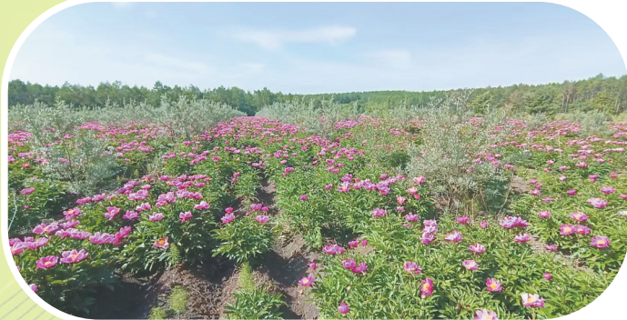
沙棘(白芍)种植基地。