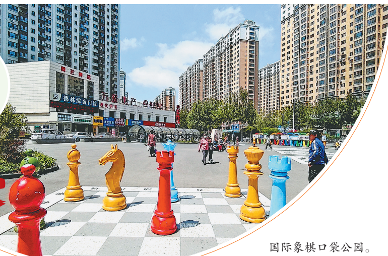
国际象棋口袋公园。