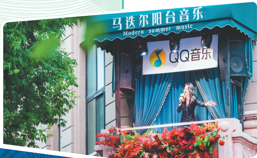
“QQ音乐x马迭尔周末阳台音乐会”。

广袤的原始森林,绿意盎然,郁郁葱葱;清澈的江河湖泊,碧波荡漾,鱼翔浅底;热情的龙江人民,豪爽大方,真诚宽厚……依托特色文化旅游资源,黑龙江正不断深耕避暑养生、康养度假优势资源,“北国好风光,美在黑龙江”旅游品牌越叫越响。随着夏日的脚步悄然而至,清凉龙江再次敞开了它的怀抱,热情地邀约各地的游客北上龙江,尽享北国夏日的独特魅力。