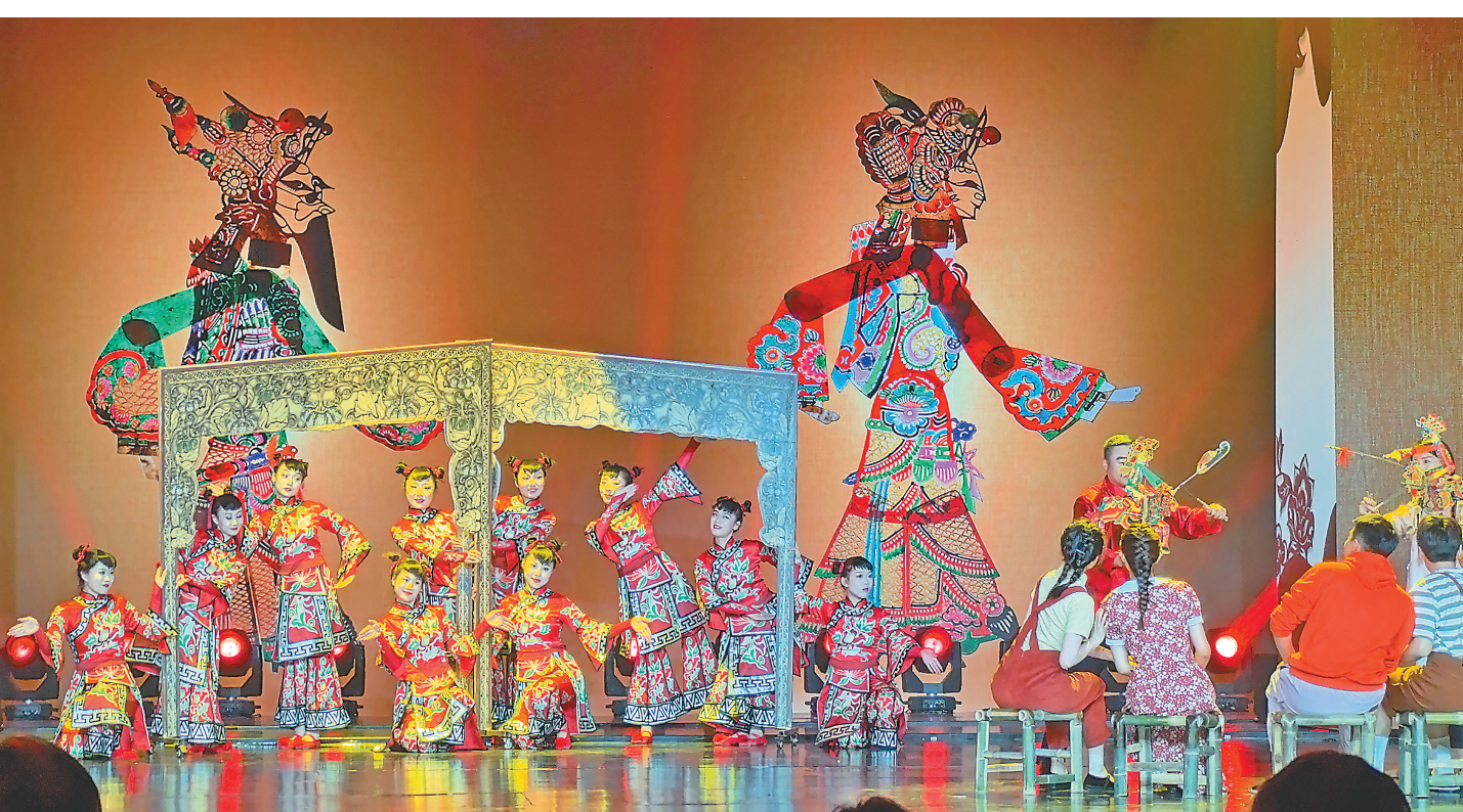
黑龙江省特色文化旅游全球推介会在齐齐哈尔举行。