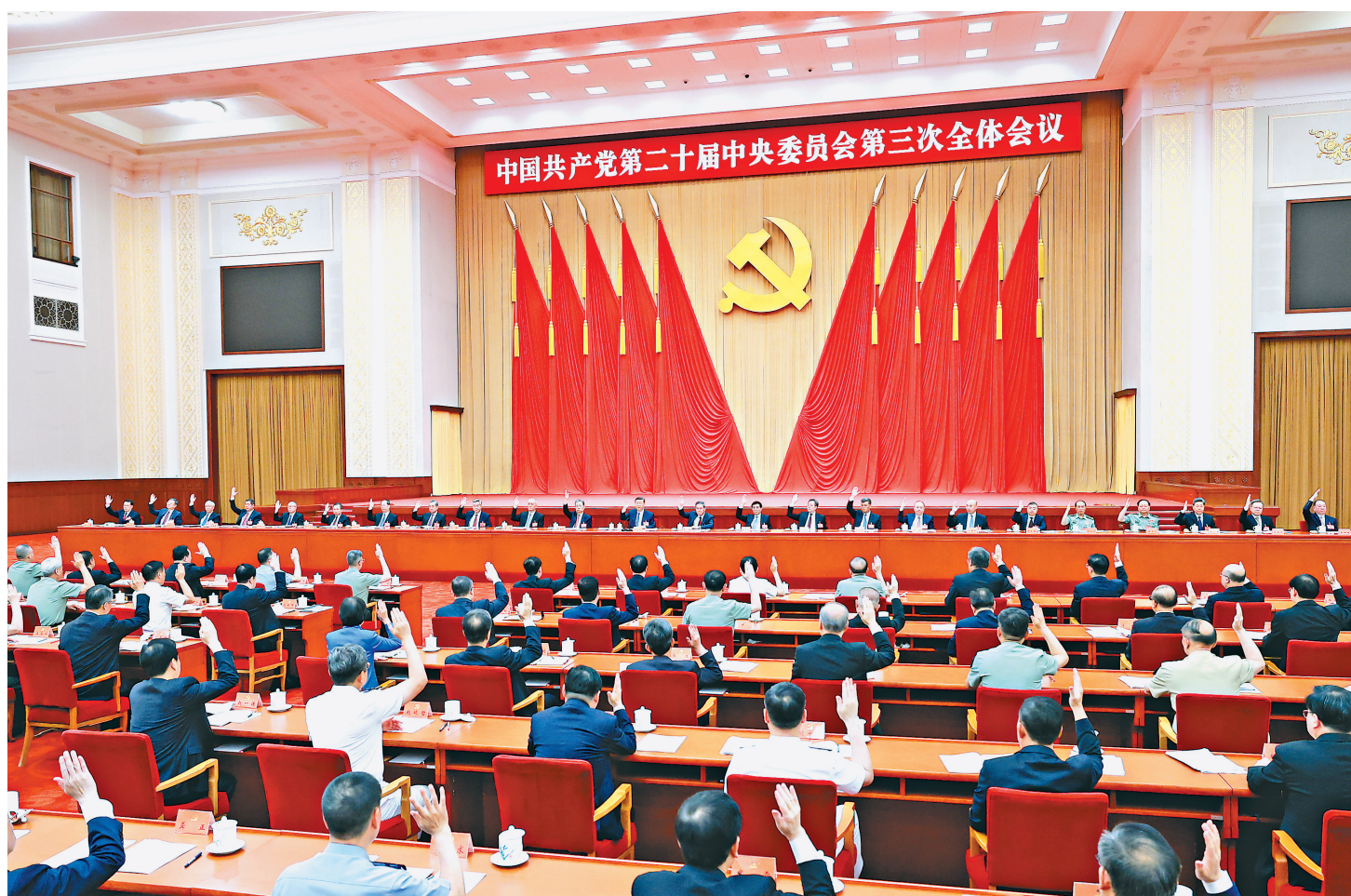
中国共产党第二十届中央委员会第三次全体会议,于2024年7月15日至18日在北京举行。中央委员会总书记习近平作重要讲话。