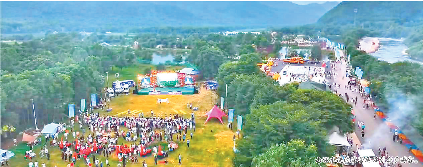
山环水绕的露营地吸引众多游客。