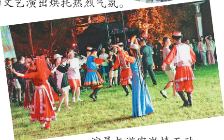
演员与游客激情互动。