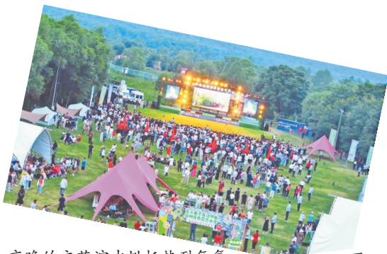
夜晚的文艺演出烘托热烈气氛。

围绕全省夏季避暑旅游“百日行动”,伊春市设计推出“最林都”6大旅游产品,“心伊春”6条旅游精品线路,举办“森林康养露营大会”“森林电音狂欢季”“桦树汁啤酒节”等数十项大型文旅活动,加大线上线下宣传力度,清凉“伊”夏活动曝光量累计突破10亿次,亲子研学、房车露营、森林徒步、康养旅居等旅游项目受到游客热烈欢迎,伊春已经进入“热辣滚烫”的旅游旺季。