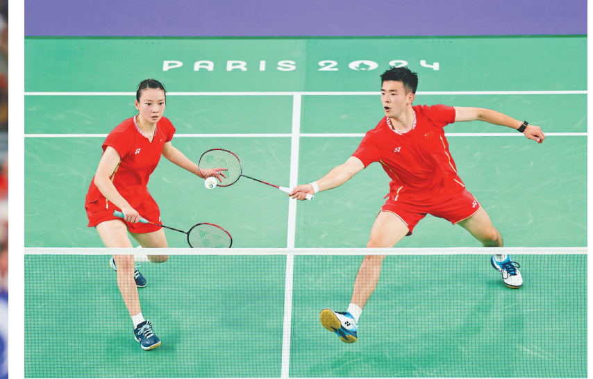
8月2日,在巴黎奥运会羽毛球混合双打决赛中,中国组合郑思维/黄雅琼2比0战胜韩国组合金元昊/郑娜英,夺得金牌。 左图:郑思维(左)/黄雅琼在比赛中庆祝。右图:郑思维/黄雅琼(左)在比赛中。