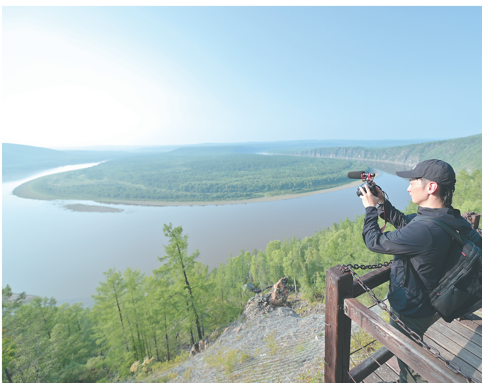
采风团记者拍摄龙江第一湾。